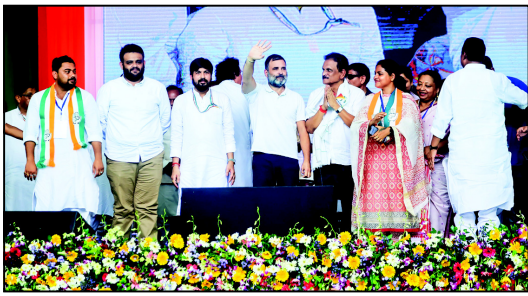
୨୦୦ ଯୁନିଟ ମାଗଣା ବିଜୁଳି, ୫ ଶହ ଟଙ୍କାରେ ଗ୍ୟାସ୍

ସାଲେପୁର/ଭୁବନେଶ୍ୱର, ୨୮।୪: ଓଡ଼ିଶାବାସୀଙ୍କୁ କଂଗ୍ରେସ ନେତା ରାହୁଲ ଗାନ୍ଧି ରବିବାର ଦେଖିବାକୁ କିଛି ଗ୍ୟାରେଣ୍ଟି। ସାଲେପୁରରେ ଆୟୋଜିତ କଂଗ୍ରେସ ସମାବେଶରେ ଓଡ଼ିଶାବାସୀଙ୍କ ଆଗରେ ସେ ରଖୁଥିବା ଗ୍ୟାରେଣ୍ଟି କେତେ ସଫଳ ହେବ ବା ବିଫଳ ହେବ ତାହା ସମୟ କହିବା ତେବେ ରାହୁଲଙ୍କ ଗ୍ୟାରେଣ୍ଟି ଅନୁଯାୟୀ ରାଜ୍ୟରେ କଂଗ୍ରେସ ସରକାର ଆସିଲେ ଆରମ୍ଭ ହେବ ‘ପେହଲି ନୌକରୀ ପକ୍କି’ ଯୋଜନା। ସମସ୍ତ ଦେଶର ଯୁବକଯୁବତୀଙ୍କୁ ଚାକିରି ଗ୍ୟାରେଣ୍ଟି ମିଳିବ। ସରକାରଙ୍କୁ କେହି ଦାବି କରି ମାଗିଲେ ନିଶ୍ଚିତ ଚାକିରି ମିଳିବ। ଚାକିରି ମାଗିବା କ୍ଷମିତ ବର୍ଷକ ପାଇଁ ବିଆସିବ ଆପେକ୍ଷିତ୍ୱିୟ। ଏଥିସହ ରାହୁଲ ପ୍ରତିଶ୍ରୁତି ଦେଇଛନ୍ତି, କଂଗ୍ରେସ ସରକାରକୁ ଆସିଲେ