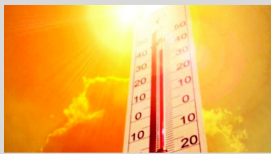
ମେ ପହିଲା ଯାଏଁ ଜାରି ରହିବ ଗ୍ରୀଷ୍ମ ପ୍ରବାହ

ଭୁବନେଶ୍ୱର, ୨୮।୪: ପ୍ରଚଣ୍ଡ ଖରାପରେ ଛପପଟ ହେଉଛନ୍ତି ରାଜ୍ୟବାସୀ। ଅସହ୍ୟ ଅଗ୍ନିବର୍ଷାକୁ ରାଜ୍ୟବାସୀଙ୍କୁ ନିଶ୍ଚାର ମିଳିପାରୁ ନାହିଁ। ରାଜ୍ୟର ୨୭ଟି ସହରରେ ଦିନତାପମାତ୍ର ୪୦ ଡିଗ୍ରୀ ସେଲସିୟସ୍ କିମ୍ବା ଅଧିକ ରେକର୍ଡ୍ କରାଯାଇଛି। ଅନୁଗୁଳରେ ସର୍ବାଧିକ ୪୪.୩ ରେକର୍ଡ୍ କରାଯାଇଛି। ୧୨ ସହରରେ ଦିନ ତାପମାତ୍ରା ୪୩ କିମ୍ବା ଅଧିକ ରେକର୍ଡ୍ ହୋଇଛି। ଭୁବନେଶ୍ୱର ଆଞ୍ଚଳିକ ପାଣିପାଗ ବିଜ୍ଞାନ କେନ୍ଦ୍ର ପକ୍ଷରୁ ମୟୂରଭଞ୍ଜ, କେନ୍ଦୁଝର, ଅନୁଗୁଳ, ବେଳାମାନ, ଖୋର୍ଦ୍ଧା, କଟକ, ଯାଜପୁର, ବୌଦ୍ଧକୁ ରେଡ଼ ଓ ଖୋର୍ଦ୍ଧା କାରି କରାଯାଇଛି। ସେହିପରି ୧୭ ଜିଲ୍ଲାକୁ ଅଂଶେକ ଖୋର୍ଦ୍ଧା ଦିଆଯାଇଛି। ସୂଚନା ଅନୁସାରେ ୩୦ ତାରିଖ ପର୍ଯ୍ୟନ୍ତ ଅସହ୍ୟ ଗ୍ରୀଷ୍ମ ପ୍ରବାହ ଅନୁଭୂତ ହେବ। ଅସହ୍ୟ ଚାଟି ପାଇଁ