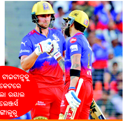
ଗୁଜରାଟ ଚାଲିବାକୁ ୯ ଡିକେଟରେ ହରାଇଲା ରୟାଲ ଚ୍ୟାଲେଞ୍ଜର୍ସ ବେଙ୍ଗାଲୁରୁ

Web: www.dinalipi.com, E-mail: dinalipinews@gmail.com