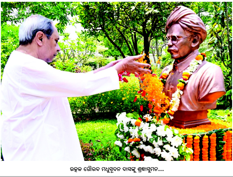
ଉତ୍କଳ ଗୌରବ ମଧୁସୂଦନ ଦାସଙ୍କ ଶ୍ରଦ୍ଧାସ୍ମରଣ...

Web: www.dinalipi.com, E-mail: dinalipinews@gmail.com