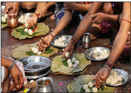
ପିଣ୍ଡଦାନ କରିବାର ଭିନ୍ନ ଭିନ୍ନ ଫଳ ମିଳିଥାଏ । ଏହାକୁ କୁହାଯାଏ ମହାଳୟା ଶ୍ରାବ । 'ମହ' ଅର୍ଥ ଉତ୍ସବର ଦିନ ଏବଂ ସେମାନଙ୍କ ତୃପ୍ତି ପାଇଁ ଶ୍ରାବ କରାଯାଏ ।

ଧାର୍ମିକତାରେ କୁହାଯାଇଛି, ପିତୃପୁରୁଷଙ୍କୁ ପିଣ୍ଡଦାନ କରୁଥିବା ପୁରୁଷ ଦୀର୍ଘାୟୁ ହେବା ସହ ସମାଧି, ପଣ, ଶାନ୍ତି, ବଳ, ଲକ୍ଷ୍ମୀ, ଗୋଧନ ଆଦି ପ୍ରାପ୍ତି କରନ୍ତି । ପିତୃପୁରୁଷଙ୍କ ଆଶାଥାଏ ଆମର ପୁଅ ନାତି ଆମକୁ ପିଣ୍ଡଦାନ କରି ସମୃଦ୍ଧ କରିବେ । ଏହି ଆଶାରେ ସେମାନେ ପିତୃଲୋକକୁ ପୃଥ୍ୱୀଲୋକକୁ ଆସନ୍ତି । ତେଣୁ ପ୍ରତ୍ୟେକ ହିନ୍ଦୁ ଗୃହସ୍ଥ ପିତୃପକ୍ଷରେ ଶ୍ରାବ କରନ୍ତି । ପ୍ରତ୍ୟେକ ଧର୍ମର ଆଧାର ଶ୍ରଦ୍ଧା । ପ୍ରତି ଧର୍ମରେ ପିତୃପୁରୁଷଙ୍କ ପ୍ରତି ସମ୍ମାନ ଏବଂ ଶ୍ରଦ୍ଧାକୁ ଗୁରୁତ୍ୱ ଦିଆଯାଏ । ସମାଜର ଧର୍ମରେ ଶ୍ରଦ୍ଧା ପ୍ରକଟ କରିବାର ଧାର୍ମିକ କର୍ମ ଶ୍ରାବ । ଶ୍ରାବକୁ ପିତୃପକ୍ଷ ମଧ୍ୟ କୁହାଯାଏ । ଶାସ୍ତ୍ରରେ ଆଶ୍ୱିନ ପ୍ରତିପଦା ଠାରୁ ଆରମ୍ଭ କରି ଅମାବାସ୍ୟା ପର୍ଯ୍ୟନ୍ତ ଭିନ୍ନ ଭିନ୍ନ ଦିନରେ