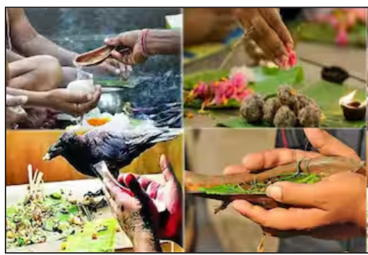
ପ୍ରମୁଖ ଶାସ୍ତ୍ର ଅନୁଯାୟୀ ପରଲୋକରତ ବ୍ୟକ୍ତିଙ୍କ ପରିବାରରେ କେତେକ ପୁତ୍ର ବା କନ୍ୟାପୁତ୍ର ଶ୍ରାବ ଦେଇପାରିବେ । ପୁତ୍ର ନ ଥିଲେ ଭଗନା, ପୁତ୍ରା, ନାତି ବା ଶିଷ୍ୟ

ପିତୃପୁରୁଷଙ୍କ ପ୍ରତି ଶ୍ରଦ୍ଧା ବ୍ୟକ୍ତ କରିବା ଏବଂ ପିତୃପୁରୁଷଙ୍କୁ ମୁକ୍ତି ପାଇବାର ପର୍ବ ପିତୃପକ୍ଷ ଅତିମ ତିଥି ମହାଳୟା । ଅବଶ୍ୟ ପିତୃପକ୍ଷ ପୂର୍ଣ୍ଣିମା ଶ୍ରାବ ପିତୃ ବିସର୍ଜନା ଅମାବାସ୍ୟାରେ ମଧ୍ୟ କରାଯାଇପାରେ । ଏଥର ଅମାବାସ୍ୟା ଅକ୍ଟୋବର ୪ ତାରିଖରେ ପଡ଼ୁଛି । ବିଦ୍ୱାନମାନଙ୍କ ମତରେ ପ୍ରତ୍ୟେକ ମଣିଷ ପାଇଁ ତିନିପ୍ରକାର ରଣ ଥାଏ - ଦେବ, ରକ୍ଷି ଏବଂ ପିତୃ । ଏ ମଧ୍ୟରୁ ଶ୍ରଦ୍ଧା ଦ୍ୱାରା ପିତୃରଣ ପରିଶୋଧ କରାଯାଏ । ଯେଉଁ ବ୍ୟକ୍ତିଙ୍କର ଯେଉଁ ତିଥିରେ ମୃତ୍ୟୁ ଘଟିଥିଲା ତାଙ୍କୁ ସେହି ତିଥିରେ ଶ୍ରାବ ଦେବା ନିମନ୍ତେ ଶାସ୍ତ୍ରରେ ନିର୍ଦ୍ଦେଶ ରହିଛି । ପୁରାଣର କାହାଣୀ ଅନୁଯାୟୀ ମନୁସ୍ମୃତି ବ୍ରହ୍ମା ଦେବଙ୍କ ପୁରାଣ ଓ ଗରୁଡ଼ ପୁରାଣ ପରି