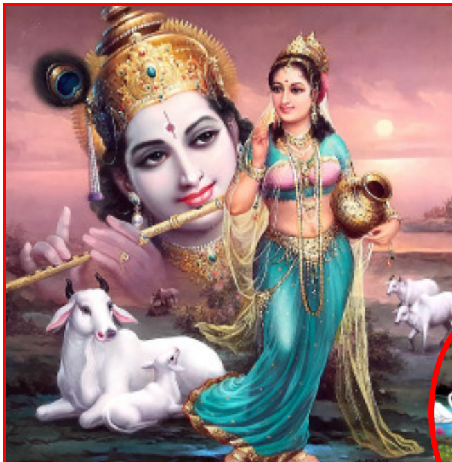
ପଦ୍ମବନରୁ ପାଳିଥିବାରୁ କନ୍ୟାର ନାମ ରାଧିକା ଦେଲେ । ସେହିପରି ବିଭିନ୍ନ ଲୋକ ବିଭିନ୍ନ ନାଁ ଦେଲେ ଯେମିତି କୃଷ୍ଣଭାନ୍ତୁ ଦେଲେ ରସବତୀ, ମା କାର୍ତ୍ତିକା ଦେଲେ ବିନୋଦିନୀ, ଯୋଗନାୟାଙ୍କ ଅବତାର ପୂର୍ଣ୍ଣମାସୀ ଦେଲେ ଶ୍ରୀମତୀ, ବୃନ୍ଦାବନର ଗୋପୀ ଦେଲେ ବୃନ୍ଦାବନେଶ୍ୱରୀ । ରାଜା ରଷି ଦୁର୍ବିସାଙ୍କୁ ଡକାଇ କନ୍ୟାର ଜାତକ ତିଆରି କରାଇଲେ...