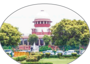
ସୁପ୍ରିମକୋର୍ଟ କହିଛନ୍ତି ଯେ ଦେଶରେ ପ୍ରତି ୮ ମିନିଟ୍‌ରେ ଜଣେ ଶିଶୁ ନିଖୋଜ ହୋଇଯାଉଛନ୍ତି। ମୋଡ଼େ କଣ ନାହିଁ ଏହା ସତ କି ମିଛ, କିନ୍ତୁ ଏହା ଏକ ଗମ୍ଭୀର ପ୍ରସଙ୍ଗ।

ସେ ସବୁ ରାଜ୍ୟ ଓ କେନ୍ଦ୍ର ଶାସିତ ରାଜ୍ୟକୁ ନିଖୋଜ ଶିଶୁଙ୍କ ମାମଲାର ସମାଧାନ ପାଇଁ ନୋଡାଲ ଅଧିକାରୀଙ୍କୁ ନିୟୁତ୍ତ କରନ୍ତୁ। ଏହା ସହିତ ମିହିନା ଏବଂ ଶିଶୁ ବିକାଶ ମନ୍ତ୍ରୀଙ୍କୁ ମାଗିଥିଲେ। ସଫଳତା ପ୍ରାପ୍ତି ପରେ ୧୫ ଲକ୍ଷ ଟଙ୍କା ଲେଖାଏଁ ପୁରସ୍କାର ରାଶି ପ୍ରଦାନ କରାଯାଇଛି। ଗଞ୍ଜାମ ଜିଲ୍ଲାରେ ୯,୪୦୨ ଟି କାର୍ଯ୍ୟ ସମ୍ପୂର୍ଣ୍ଣ ହୋଇଥିବା ବେଳେ ମୟୂରଭଞ୍ଜ, କଳାହାଣ୍ଡି, ରାୟଗଡ଼ା, କଟକ ଜିଲ୍ଲାରେ ଅଧାକ୍ରମେ ୧୫,୧୪୧, ୬,୬୭୮, ୮,୨୩୭, ୫,୫୭୨ ଟି ଲେଖାଏଁ କାର୍ଯ୍ୟ ସମ୍ପୂର୍ଣ୍ଣ ହୋଇଛି।