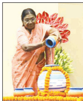
ଭୁବନେଶ୍ୱରରେ ରାଜ୍ୟର ଶ୍ରେଷ୍ଠ ପ୍ରଦର୍ଶନକାରୀ ଜିଲ୍ଲା ମଧ୍ୟରେ ଓଡ଼ିଶାର ଗଞ୍ଜାମ, ମୟୂରଭଞ୍ଜ, କଳାହାଣ୍ଡି, ରାୟଗଡ଼ା, କଟକ ତୃତୀୟ ବର୍ତ୍ତମାନ ପୁରସ୍କୃତ ହୋଇଛନ୍ତି। ଏସବୁ ଜିଲ୍ଲାରେ ବିଭିନ୍ନ ଜଳସଂଚୟ ସଫଳତାର ପୂର୍ବକ କାର୍ଯ୍ୟକାରୀ କରିବା ଲାଗି ପ୍ରତ୍ୟେକ ଜିଲ୍ଲାକୁ ୨୫ ଲକ୍ଷ ଟଙ୍କା ଲେଖାଏଁ ପୁରସ୍କାର ରାଶି ପ୍ରଦାନ କରାଯାଇଛି।

ଭୁଆଦିଲ୍ଲୀ, ୧୮।୧୧: ରାଷ୍ଟ୍ରପତି ଶ୍ରୀମତୀ ଦ୍ରୌପଦୀ ମଙ୍ଗଳବାର ରାଜଧାନୀରେ ଏକ ସମାରୋହରେ ଶଷ୍ଠ ଜାତୀୟ ଜଳ ପୁରସ୍କାର ଏବଂ ଜଳ ସଂରକ୍ଷଣ-ଜନ ଭାଗାଦାବା ପୁରସ୍କାର ପ୍ରଦାନ କରିଛନ୍ତି। ସେ ଗୁରୁତ୍ୱାରୋପ କରିଛନ୍ତି ଯେ ପ୍ରକାଶକାରୀ ଜଳ ପରିଚାଳନା କେବଳ ବ୍ୟକ୍ତି, ପରିବାର, ସମାଜ ଏବଂ ସରକାରଙ୍କ ଅଂଶଗୃହଣ ଦ୍ୱାରା ସମ୍ଭବ। ନଦୀ, ହ୍ରଦ ଏବଂ ଜଳ ଉତ୍ସ ପ୍ରତି ଭାରତର ସାଂସ୍କୃତିକ ଶ୍ରଦ୍ଧା ପ୍ରତିଫଳିତ ହୋଇଛି। ସୂଚୀରେ ଉଲ୍ଲେଖ ଅଛି ଯେ ଶ୍ରୀମତୀ ଦ୍ରୌପଦୀ ଆଲୋଚନା କରିଥିଲେ ଯେ ଦକ୍ଷ ଜଳ ବ୍ୟବହାର ବିଶ୍ୱସ୍ତରୀୟ ଆବଶ୍ୟକତା ଏବଂ ଭାରତ ପାଇଁ ଆହୁରି ଗୁରୁତ୍ୱପୂର୍ଣ୍ଣ। ସେ ଚେତାବନା ଦେଇଥିଲେ ଯେ ଜଳବାୟୁ ପରିବର୍ତ୍ତନ ଜଳସଂଚୟକୁ ବାଧା ଦେଉଛି ଏବଂ ଜଳ ଉପଲବ୍ଧତା ଏବଂ ପୁରଣ ସୁନିଶ୍ଚିତ କରିବା ପାଇଁ ସାମୂହିକ ପଦକ୍ଷେପ ନେବାକୁ ଅନୁରୋଧ କରିଛନ୍ତି। ଗତବର୍ଷ ଆରମ୍ଭ ହୋଇଥିବା ଜଳ ସଂରକ୍ଷଣ-ଜନ ଭାଗାଦାବା ପଦକ୍ଷେପ ଅଧୀନରେ ୩୫ ଲକ୍ଷରୁ ଅଧିକ ମଧ୍ୟ ପ୍ରଶଂସା କରିଥିଲେ। ପ୍ରାକୃତିକ ସମ୍ପଦକୁ ଗଭୀର ଭାବରେ ସମ୍ମାନ କରୁଥିବା ଆଦିବାସୀ ସମ୍ପ୍ରଦାୟଙ୍କୁ ପ୍ରୋତ୍ସାହନ ଦେବା, ରାଷ୍ଟ୍ରପତି ସଂରକ୍ଷଣ ଦିବସରେ ସଫଳତା ଏବଂ ସଂରକ୍ଷଣ ଏବଂ ପରିଚାଳନା କ୍ଷେତ୍ରରେ ଅନୁକରଣୀୟ କାର୍ଯ୍ୟ ପାଇଁ ୧୦ଟି ବର୍ତ୍ତମାନ ମିଳିତ ବିଜେତାଙ୍କ ସମେତ ୪୬ ଜଣ ବିଜେତାଙ୍କୁ ପୁରସ୍କୃତ କରାଯାଇଥିଲା। ଶ୍ରେଷ୍ଠ ପ୍ରଦର୍ଶନକାରୀ ଜିଲ୍ଲା ମଧ୍ୟରେ ଓଡ଼ିଶାର ଗଞ୍ଜାମ, ମୟୂରଭଞ୍ଜ, କଳାହାଣ୍ଡି, ରାୟଗଡ଼ା, କଟକ ତୃତୀୟ ବର୍ତ୍ତମାନ ପୁରସ୍କୃତ ହୋଇଛନ୍ତି। ଏସବୁ ଜିଲ୍ଲାରେ ବିଭିନ୍ନ ଜଳସଂଚୟ ସଫଳତାର ପୂର୍ବକ କାର୍ଯ୍ୟକାରୀ କରିବା ଲାଗି ପ୍ରତ୍ୟେକ ଜିଲ୍ଲାକୁ ୨୫ ଲକ୍ଷ ଟଙ୍କା ଲେଖାଏଁ ପୁରସ୍କାର ରାଶି ପ୍ରଦାନ କରାଯାଇଛି। ଗଞ୍ଜାମ ଜିଲ୍ଲାରେ ୯,୪୦୨ ଟି କାର୍ଯ୍ୟ ସମ୍ପୂର୍ଣ୍ଣ ହୋଇଥିବା ବେଳେ ମୟୂରଭଞ୍ଜ, କଳାହାଣ୍ଡି, ରାୟଗଡ଼ା, କଟକ ଜିଲ୍ଲାରେ ଅଧାକ୍ରମେ ୧୫,୧୪୧, ୬,୬୭୮, ୮,୨୩୭, ୫,୫୭୨ ଟି ଲେଖାଏଁ କାର୍ଯ୍ୟ ସମ୍ପୂର୍ଣ୍ଣ ହୋଇଛି।