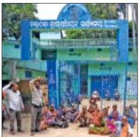
ସରକାର ଲୋକଙ୍କୁ ଗୁଆଁ ବୁଲାଇ ଦାଲିଥିବା ନେଇ କାଉପଡ଼ା ଲୋକ ଅଭିଯୋଗ କରିଛନ୍ତି । ଏହା ସତ୍ତ୍ୱେ ମଧ୍ୟ ବିଷୟ ବିଷୟ ପାଇଁ ନାହିଁ । ଦାରିଦ୍ର୍ୟ ଚାରିମାସରୁ ଉର୍ଦ୍ଧ୍ୱ ହେବ କାଉପଡ଼ା ଗ୍ରାମକୁ ପିଇବା ପାଣି ଆସୁ ନ ଥିବା ବେଳେ ବାରମ୍ବାର ଗୁଆଁ ବୁଲାଇ ସରକାର ଏବଂ ଆରତ୍ୟୁଏସଏସ ବୁଦ୍ଧ ସହାୟକ ଜଣାଇଥିଲା ପରେ ମଧ୍ୟ କୌଣସି

କେନ୍ଦ୍ରାପଡ଼ା, ୩୦/୪(ନିପ୍ର): ତେରାବିଶ ବୁଦ୍ଧ ଅନ୍ତର୍ଗତ କାଉପଡ଼ା ଗ୍ରାମପଞ୍ଚାୟତ କାଉପଡ଼ା ଗ୍ରାମରେ ୨୦୦ ରୁ ୨୫୦ ଲୋକ ବସବାସ କରନ୍ତି । ବ୍ୟତିକ୍ରମ ବିଷୟ ସେମାନଙ୍କ ପାଇଁ ପର୍ଯ୍ୟାପ୍ତ ପରିମାଣରେ ଗ୍ରାମକୁ ଆସୁନାହିଁ ପିଇବା ପାଣି । ଏତେ ପରିମାଣରେ ଲୋକ ରହୁଥିବା ବେଳେ ଆବଶ୍ୟକ ମାତ୍ରାରେ ବି ନାହିଁ ନଳକୃପ । ଗ୍ରାମରେ ବାରମ୍ବାର ପାଣି ଲାଭ ନ ଶୁଭାପ ହେଉଥିବା ବେଳେ ଲୋକେ ପିଇବା ପାଣି ପାଇଁ ଡହଳିକଳ ହେଉଛନ୍ତି । ଉଚ୍ଚ ସମସ୍ୟା ବିଷୟରେ କାଉପଡ଼ା ଗ୍ରାମବାସୀଙ୍କ ଦ୍ୱାରା ତେରାବିଶ ବିଡ଼ିଓ ଏବଂ ଆରତ୍ୟୁଏସଏସ ସହାୟକ ଦୁଷ୍ଟିଗୋଚର କରାଯାଇଥିଲା ଯାହା କୌଣସି ସୁଫଳ ମିଳିପାରୁନାହିଁ । ଗ୍ରାମର ବୃକ୍ଷଠାରୁ ପିଇବା ପର୍ଯ୍ୟନ୍ତ ଦୈନନ୍ଦିନ ଆବନରେ ଏଭଳି ଅସୁବିଧା ସମ୍ମୁଖୀନ ହେଉଥିବା ବେଳେ ଉଚ୍ଚ ବିଷୟରେ ସରକାରଙ୍କୁ ମଧ୍ୟ ବାରମ୍ବାର ଜଣାଇଥିଲେ । କିନ୍ତୁ