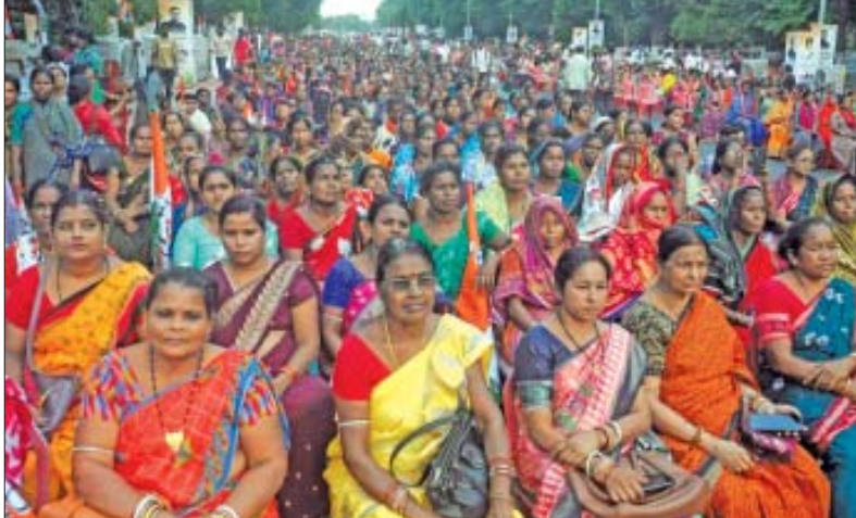
୩୩ ପ୍ରତିଶତ ମହିଳା ଆରକ୍ଷଣ ବିକଳ ରୁଗଣ ଲାଗୁ କରିବା ଦାବିରେ ଓଡ଼ିଶା ପ୍ରଦେଶ ମହିଳା କଂଗ୍ରେସ ପକ୍ଷରୁ ବିଧାନସଭା ଯୋଗାଣ (ଏମୋ-ଦିନଲିପି)

ପହଞ୍ଚିଥିବା ବେଳେ କାଲସାଭିଆ ଆଲୁମିନା ଉତ୍ପାଦନ ୨୨.୭୫ ଲକ୍ଷ ଟଙ୍କାରେ ପହଞ୍ଚିଛି । ସେହିପରି, କାଷ୍ ଧାତୁ ଉତ୍ପାଦନ ସର୍ବାଧିକ ୪.୭୨ ଲକ୍ଷ ଟଙ୍କା, ୬.୯୫୩ ମିଲିମିଟର ସ୍ଥିର ରେକର୍ଡ୍ ନେଟ୍ ବିଦ୍ୟୁତ୍ ଉତ୍ପାଦନ ଏବଂ ୪୦ ଲକ୍ଷ ଟଙ୍କା କୋଲୋ ମଧ୍ୟ ଉତ୍ପାଦନ କରାଯାଇଛି । ବିକ୍ରୟ ଶେଷରେ, ନାଲକୋ ଅନୁତ୍ପାଦନ ସଫଳତା ହାସଲ କରିଛି । ମୋଟ ଆଲୁମିନା ବିକ୍ରୟ ୧୪.୪୬ ଲକ୍ଷ ଟଙ୍କାରେ ପହଞ୍ଚିଥିବା ବେଳେ (୧.୩୮ ଲକ୍ଷ ଟଙ୍କା ଘଟଣା ଆଲୁମିନା ବିକ୍ରୟ ଅନ୍ତର୍ଭୁକ୍ତ), ଆଲୁମିନିୟମ ଧାତୁ ବିକ୍ରୟ ୪.୭୪ ଲକ୍ଷ ଟଙ୍କା ହୋଇଛି ଯେଉଁଥିରେ ଘଟଣା ବଜାରରେ ସର୍ବାଧିକାୟ ସର୍ବାଧିକ ୪.୬୧ ଲକ୍ଷ ଟଙ୍କା ଧାତୁ ବିକ୍ରୟ ଅନ୍ତର୍ଭୁକ୍ତ । 'ଉତ୍ପାଦନ ପରିମାଣ ବୃଦ୍ଧି, ଉତ୍ପାଦନ ପିଠି ମୂଲ୍ୟ ଏବଂ ବଜାର ସୁଯୋଗକୁ ଲୁଣ୍ଠନା ଚଳେଇ ବ୍ୟବହାର କରିବାରେ ଆମର ଦକ୍ଷତା ଯୋଗୁଁ ଏହି ଫଳାଫଳ ହାସଲ ହୋଇପାରିଛି ।