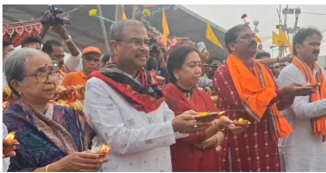
କାର୍ଯ୍ୟରେ ସାମିଲ ହୋଇଥିଲେ । ପରିବେଶକୁ ସୁନ୍ଦର ରଖିବା ପ୍ରତ୍ୟେକ ନାଗରିକଙ୍କ ଦାୟିତ୍ୱ ବୋଲି ସେ ମତବ୍ୟକ୍ତ କରିଥିଲେ । ଏହାସହ ଶ୍ରୀ ପ୍ରଧାନ ସପରିବାର ଯାତ୍ରାରେ ଆସିଥିବା ଶ୍ରୀକାଳୀମନ୍ଦିର ଅନୁ ପ୍ରସାଦ ବିତରଣ କରିବା ସହ ବିଭିନ୍ନ ସେବା କାର୍ଯ୍ୟରେ ନିଜକୁ ନିୟୋଜିତ

ତାଳଚେର, (ନିପ୍ତ): ତାଳଚେରର ଅଧିଷ୍ଠା ଦେବୀ, ଶକ୍ତିସ୍ୱରୂପିଣୀ ଅର୍ଚ୍ଚିତା ମା' ହିଙ୍ଗୁଳାଙ୍କ ପବିତ୍ର ନବଦିନୀୟକ ଯାତ୍ରା ଅବସରରେ କେନ୍ଦ୍ର ଶିଖାପଣା ଧର୍ମେନ୍ଦ୍ର ପ୍ରଧାନ ସପରିବାର ମା'ଙ୍କ ମନ୍ଦିରକୁ ପରିବର୍ତ୍ତନ କରିଥିଲେ । ସେ ମନ୍ଦିରରେ ଦର୍ଶନ କରିବା ସହ ପବିତ୍ର ଭଜା ସ୍ଥଳରେ ପୂଜାର୍ଚ୍ଚନା କରିଥିଲେ । ମା'ଙ୍କ ସ୍ୱତନ୍ତ୍ର ବେଶ ଦର୍ଶନ କରି ଶ୍ରୀ ପ୍ରଧାନ ନିଜକୁ କୃତାର୍ଥ ମନେ କରିଥିବା ବେଳେ, ମା' ହିଙ୍ଗୁଳାଙ୍କୁ ସମାଜର ସଭ୍ୟତା ଅନନ୍ୟ ସଂସ୍କୃତିକ, ଧାର୍ମିକ ଓ ଆଧ୍ୟାତ୍ମିକ ଚେତନାର ପ୍ରତୀକ ବୋଲି ଦର୍ଶନ କରିଥିଲେ । ସେ କହିଥିଲେ ଯେ, ଦୃଷ୍ଟିର ପ୍ରାନ୍ତରୁ ଅଗ୍ନିରୂପେ ଅଧିଷ୍ଠିତ ମା' ତାଳଚେରବାସୀଙ୍କୁ ନିରନ୍ତର ଆଶୀର୍ବାଦ ପ୍ରଦାନ କରୁଛନ୍ତି । ଶ୍ରୀମନ୍ଦିର ରୋଷସରର ଠାକୁରାଣୀ ଭାବେ ବିଶ୍ୱବ୍ୟାପୀ ପରିଚିତ । ଏହି ଅବସରରେ ଶ୍ରୀ ପ୍ରଧାନ ମା'ଙ୍କ ଶ୍ରୀଚରଣରେ ଅନୁଗ୍ରହ ମାଗିବାର ପ୍ରାର୍ଥନା ସହ 'ବିକଶିତ ଓଡ଼ିଶା' ଓ 'ବିକଶିତ ଭାରତ' ଗଠନର ସଂକଳ୍ପ ସାଧନା ହେବାକୁ ପ୍ରାର୍ଥନା କରିଥିଲେ । ଗଣ ସମୟରେ ସେ ପ୍ରଧାନମହାଙ୍କ "ସୁଭ୍ରତା ହିଁ ସେବା" ଆହ୍ୱାନକୁ ଅନୁସରଣ କରି ମା'ଙ୍କ ପୀଠରେ ସ୍ମରଣା