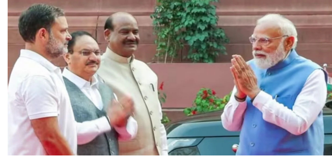
ନୂଆଦିଲ୍ଲୀ, ୧୧୧୪: ଶନିବାର ସଂସଦ ପରିସରକୁ ଏକ ଭିଡିଓ ସାମ୍ବାଦିକ ଆସିଛି । ଭିଡିଓରେ ପ୍ରଧାନମନ୍ତ୍ରୀ ନରେନ୍ଦ୍ର ମୋଦି ଏବଂ ସଂସଦ ସଦସ୍ୟ ରାହୁଲ ଗାନ୍ଧୀଙ୍କ ମଧ୍ୟରେ କଥାବାର୍ତ୍ତା ହେଉଥିବାକୁ ଦେଖିବାକୁ ମିଳୁଛି । ଦୁଇ ନେତା ପ୍ରାୟ ୧ ମିନିଟ୍ ୩୪ ସେକେଣ୍ଡ ଧରି ଆଲୋଚନା କରୁଥିବା ଦେଖାଯାଇଛି । ଭିଡିଓରେ ଦେଖାଯାଇଛି ପ୍ରଧାନମନ୍ତ୍ରୀ ମୋଦି ପ୍ରଥମେ ଉପସ୍ଥିତ ଅନ୍ୟ ସଂସଦମାନଙ୍କୁ ଅଭିବାଦନ କରୁଛନ୍ତି, ତା'ପରେ ରାହୁଲ ଗାନ୍ଧୀଙ୍କ ପାଖକୁ ଫେରି ତାଙ୍କ ସହିତ କଥାବାର୍ତ୍ତା କରୁଛନ୍ତି । ଗାନ୍ଧୀ ମଧ୍ୟ ସମାନ କଥାକଲ ହେଉଛି ।