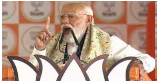
ବର୍ଷମାନ, ୧୧୧୪: ପଶ୍ଚିମବଙ୍ଗର ବିରୋଧରେ ଏକ ଶାଣିତ ଆକ୍ରମଣ ରାଜନୈତିକ ରଣାଙ୍ଗଣରେ ପ୍ରଧାନମନ୍ତ୍ରୀ ନରେନ୍ଦ୍ର ମୋଦି ଶନିବାର ମମତା ବାନାର୍ଜୀଙ୍କ ନେତୃତ୍ୱାଧୀନ ବୃକ୍ଷପୂଜା (ଟିଏମସି) ଦଳର ବିରୋଧରେ ଏକ ଶାଣିତ ଆକ୍ରମଣ କରିଛନ୍ତି। ବିଜେପି ପ୍ରତି ଜନସାଧାରଣଙ୍କ ବହୁଥିବା ସମର୍ଥନ ଦେଖି ଟିଏମସି ଏବେ 'ପ୍ୟାନିକ୍ ମୋଡ୍' ବା ଆତଙ୍କିତ ଅବସ୍ଥାରେ ରହିଛି ବୋଲି ପ୍ରଧାନମନ୍ତ୍ରୀ କହିଛନ୍ତି।