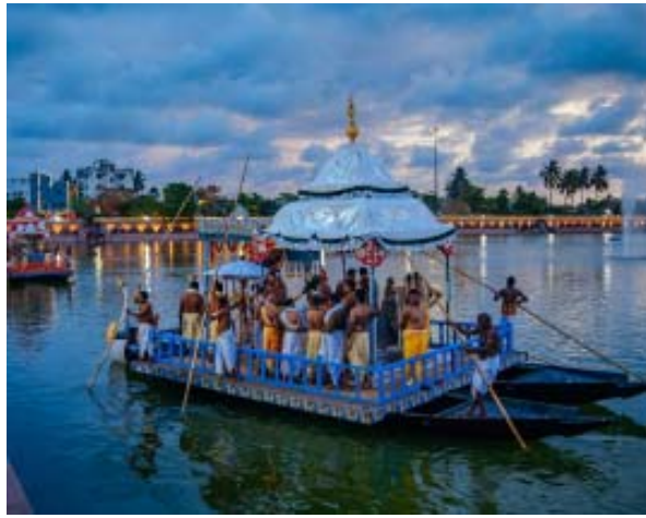
ଆଧୁନିକ ଓ ଆଧ୍ୟାତ୍ମିକ ହରଣ ନିମନ୍ତେ ଠାକୁରଙ୍କୁ ଚନ୍ଦନ କେପନ କରାଯାଇଥାଏ । ସିଂହାରୀ ସେବକମାନେ ଠାକୁରଙ୍କୁ ଏହି ସେବା କରିଥାନ୍ତି ।

ଶ୍ରୀକଗନ୍ଧା ମହାପ୍ରଭୁଙ୍କର ୨୧ ଦିନ ବ୍ୟାପୀ ବାହାର ଚନ୍ଦନଯାତ୍ରା ଅଭିମାନ ଦିବସରେ ଭଉଁରୀଯାତ୍ରା ଅନୁଷ୍ଠିତ ହୋଇଥାଏ । ପରମ୍ପରା ଅନୁଯାୟୀ ମଦନମୋହନ, ବକରାମ, କୃଷ୍ଣ, ଶ୍ରୀଦେବୀ ଓ ଭୂଦେବୀଙ୍କ ସମେତ ଶ୍ରୀଲୋକନାଥ, ଶ୍ରୀନାକଞ୍ଜେଶ୍ୱର, ଶ୍ରୀନାକଞ୍ଜେଶ୍ୱର, ଶ୍ରୀକମ୍ପେଶ୍ୱର ଏବଂ ଶ୍ରୀକପାଳମୋହନଙ୍କୁ ଏକ ବର୍ଷାବ୍ୟ ଶୋଭାଯାତ୍ରାରେ ନରେନ୍ଦ୍ର ପୁଷ୍କରିଣୀକୁ ବିଜେ କରାଯାଏ । ଭଉଁରୀ ଦିନ କେବଳ ଦିନଚାପ କରାଯାଏ, ରାତ୍ରିଚାପ କରାଯାଏ ନାହିଁ, ଦିନଚାପରେ ନରେନ୍ଦ୍ର ପୋଖରୀର ଦାସବାଣି ଚାରିପଟେ ୨୧ ଘେରା ବୁଲାଇଯାଏ । ଠାକୁରମାନେ ନରେନ୍ଦ୍ର ପୋଖରୀରେ ୨୧ ଘେରା ଚାପ ଖେଳିବା ପରେ ଶ୍ରୀମନ୍ଦିରକୁ ବାହୁଡ଼ାବିଜେ କରିଥାନ୍ତି । ପରମ୍ପରା ଅନୁଯାୟୀ ଭଉଁରୀଦିନ ସକାଳୁପୁଅ ହେବାପରେ ପୁଜାପଞ୍ଚମାନେ ଶ୍ରୀକାଉଁରୀନାଥଙ୍କ ଆଜ୍ଞାମାଳଧାରୀ ରଥଖଣ୍ଡକୁ ଯାଇଥାନ୍ତି । ସେଠାରେ ଶ୍ରୀଅଙ୍ଗୁଳାରି ଏହି ଆଜ୍ଞାମାଳକୁ ମହାରଣା ସେବକମାନେ ପାଇବାପରେ ନିର୍ମାଣାଧିନ ତିନିରଥର ତିନୋଟି ଅଞ୍ଚଳରେ ପୁରୁଣି ଲେଖାଏଁ ଚକ ସଂଯୋଗ କରିଥାନ୍ତି । ଭଉଁରୀଯାତ୍ରା ପରଦିନ ଶ୍ରୀକାଉଁରୀନାଥଙ୍କ ହଳଦୀପାଣି ନୀତି ଅନୁଷ୍ଠିତ ହୋଇଥାଏ । ଏଥିରେ ଆଜ୍ଞାମାଳ ପାଇବାପରେ ବିମାନ କେଳେକି ଠାକୁରମାନେ ନରେନ୍ଦ୍ରପୁଷ୍କରିଣୀରେ ପହଞ୍ଚିବାପରେ କେବଳ ମଦନମୋହନ, ଶ୍ରୀଦେବୀ ଓ ଭୂଦେବୀ ଚାପତଙ୍ଗୀକୁ ବିଜେକରି ହଳଦୀପାଣୀ ପିତକାରୀ ଖେଳିଥାନ୍ତି ।