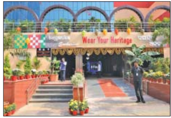
କୋଳକାତା ଭଳି ପ୍ରମୁଖ ମହାନଗରଗୁଡ଼ିକରେ ୪୦ଟି ଖୁରୁଦା ବୋକାଳର ନେତୃତ୍ୱ ପରିଚାଳନା କରୁଛି । ଏହି ଆଡ଼ଭେଲେଟ୍ କେବଳ ବାଣିଜ୍ୟର ବିନ୍ଦୁ ନୁହେଁ; ଏଗୁଡ଼ିକ ଓଡ଼ିଶାର ସାଂସ୍କୃତିକ ପରିଚୟର ଜୀବନ୍ତ ପ୍ରକାଶନ, ଯେଉଁଠାରେ ପ୍ରତ୍ୟେକ ଦୁଶାଳାର ପରମ୍ପରା, ଦକ୍ଷତା ଏବଂ ନିଜରତାର କାହାଣୀ ବର୍ଣ୍ଣନା କରେ । ଦଶନ୍ଧି ଧରି, ବୟନିକା ଏହାର ମୂଳ ମୂଲ୍ୟବୋଧରେ ମୂଳ ରହି ପରିବର୍ତ୍ତନଶୀଳ ସମୟ ସହିତ ନିରନ୍ତର ଗ୍ରହଣ କରିଛି । କ-କମର୍ସରେ ଏହାର ପ୍ରସାର ଓଡ଼ିଶାର ହସ୍ତତନ୍ତ ଉତ୍ପାଦନକୁ

କୋଳକାତା ଭଳି ପ୍ରମୁଖ ମହାନଗରଗୁଡ଼ିକରେ ୪୦ଟି ଖୁରୁଦା ବୋକାଳର ନେତୃତ୍ୱ ପରିଚାଳନା କରୁଛି । ଏହି ଆଡ଼ଭେଲେଟ୍ କେବଳ ବାଣିଜ୍ୟର ବିନ୍ଦୁ ନୁହେଁ; ଏଗୁଡ଼ିକ ଓଡ଼ିଶାର ସାଂସ୍କୃତିକ ପରିଚୟର ଜୀବନ୍ତ ପ୍ରକାଶନ, ଯେଉଁଠାରେ ପ୍ରତ୍ୟେକ ଦୁଶାଳାର ପରମ୍ପରା, ଦକ୍ଷତା ଏବଂ ନିଜରତାର କାହାଣୀ ବର୍ଣ୍ଣନା କରେ । ଦଶନ୍ଧି ଧରି, ବୟନିକା ଏହାର ମୂଳ ମୂଲ୍ୟବୋଧରେ ମୂଳ ରହି ପରିବର୍ତ୍ତନଶୀଳ ସମୟ ସହିତ ନିରନ୍ତର ଗ୍ରହଣ କରିଛି । କ-କମର୍ସରେ ଏହାର ପ୍ରସାର ଓଡ଼ିଶାର ହସ୍ତତନ୍ତ ଉତ୍ପାଦନକୁ ପ୍ରକାଶନ, ଯେଉଁଠାରେ ପ୍ରତ୍ୟେକ ଦୁଶାଳାର ପରମ୍ପରା, ଦକ୍ଷତା ଏବଂ ନିଜରତାର କାହାଣୀ ବର୍ଣ୍ଣନା କରେ । ଦଶନ୍ଧି ଧରି, ବୟନିକା ଏହାର ମୂଳ ମୂଲ୍ୟବୋଧରେ ମୂଳ ରହି ପରିବର୍ତ୍ତନଶୀଳ ସମୟ ସହିତ ନିରନ୍ତର ଗ୍ରହଣ କରିଛି । କ-କମର୍ସରେ ଏହାର ପ୍ରସାର ଓଡ଼ିଶାର ହସ୍ତତନ୍ତ ଉତ୍ପାଦନକୁ