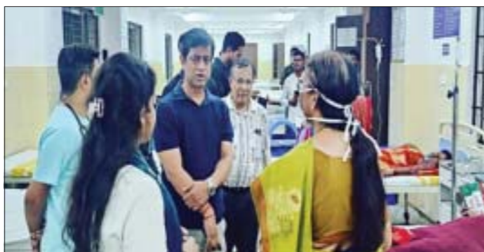
ଅଧିକାରୀଙ୍କ ସହ ଜିଲ୍ଲା ମୁଖ୍ୟାଳୟ ଡାକ୍ତରଖାନା ପରିଦର୍ଶନ କରିଥିଲେ । ଚିକିତ୍ସା କରୁଥିବା ଡାକ୍ତର ମାନଙ୍କ ସହ କଥା ହୋଇ