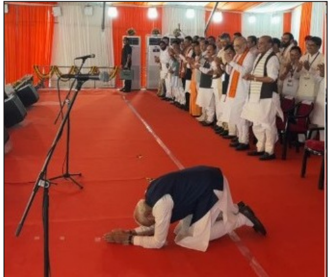
ଶୁଭେନ୍ଦୁଙ୍କ ଶପଥ ଗ୍ରହଣ ସମାବେଶରେ ବଜାବାସୀଙ୍କୁ ପ୍ରଣିପାତ କଲେ ପ୍ରଧାନମନ୍ତ୍ରୀ ନରେନ୍ଦ୍ର ମୋଦି ।

ଲୋକ ଥିବା ସ୍ଥାନ । ଏଠାରେ ଜଣେ ସଂକ୍ରମିତ ହେଲେ ଖୁବ୍ ଶୀଘ୍ର ଅନ୍ୟମାନଙ୍କ ପାଖକୁ ଏହି ଭାଇରସ୍ ପହଞ୍ଚିଥାଏ । ତେବେ ଏହାର ଲକ୍ଷଣ ହେଉଛି ପାଣି ଭଳି ପତଳା ଝାଡ଼ା ହେବା । ପେଟ ଯନ୍ତ୍ରଣା ଏବଂ ମୁଣ୍ଡ ବୁଲାଇବା । ସାମାନ୍ୟ କୃମି ଏବଂ ଦେହ ହାତ ବିଶା ହେବା । ଏହି ସଂକ୍ରମଣ ହଠାତ୍ ଜଣକ ପାଖରେ ହୋଇ ନଥିଲା, ବରଂ ସମ୍ପୂର୍ଣ୍ଣ ଯାତ୍ରୀ ସମୟରେ ଧୀରେ ଧୀରେ ବଢ଼ିଥିଲା । ସମସ୍ତ ଯାତ୍ରୀ ଏକା ସାଙ୍ଗରେ ଅସୁସ୍ଥ ହୋଇ ନଥିଲେ, ବରଂ ଜଣକ ପରେ ଜଣେ ଆକ୍ରାନ୍ତ ହୋଇଥିଲେ । ଏବେ କମ୍ପାନୀ ପକ୍ଷରୁ କୁହାଯାଇଛି ଯେ, ଜାହାଜକୁ ସମ୍ପୂର୍ଣ୍ଣ ରୂପେ ସାନିଟାଇଜ୍ କରାଯାଇଛି । ସଂକ୍ରମିତଙ୍କୁ ଆଇସୋଲେସନରେ ରଖାଯିବା ସହ ଯାତ୍ରୀମାନଙ୍କୁ ବାରମ୍ବାର ହାତ ଧୋଇବା ଏବଂ ସାନିଟାଇଜର ବ୍ୟବହାର କରିବାକୁ କୁହାଯାଇଛି । ସାଧାରଣତଃ ନୋରୋଭାଇରସ୍ ମାରାତ୍ମକ କିମ୍ବା ଜୀବନ ନେଲା ଭଳି ରୋଗ ନୁହେଁ । ଅଧିକାଂଶ ଲୋକ ୨ ରୁ ୩ ଦିନ ମଧ୍ୟରେ ସୁସ୍ଥ ହୋଇଯାଆନ୍ତି । ତଥାପି, ଶରୀରରେ ଜଳାୟତନ ଅଂଶ ବଜାୟ ରଖିବା ଏବଂ ସମାପ୍ତରୁ ରହିବା ଏହାର ମୁଖ୍ୟ ଚିକିତ୍ସା ।