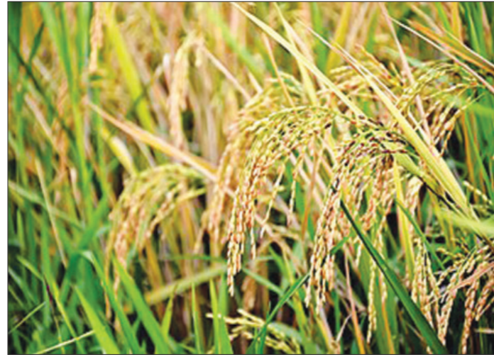
କରାଯାଇଛି । ସାଧାରଣ ଧାନ ଏବଂ ଗ୍ରେଡ୍ ଏ ଧାନର ଏମଏସପି କିଣାଯାଇ ପିଛା ୬୨୨ ଟଙ୍କା ବୃଦ୍ଧି କରାଯାଇଛି । ଉତ୍ପାଦନ ଖର୍ଚ୍ଚରେ ଫସଲ ଅମଳ ପାଇଁ ଆରମ୍ଭରୁ ଶେଷ ପର୍ଯ୍ୟନ୍ତ

ନୂଆଦିଲ୍ଲୀ, ୧୩।୫: ପ୍ରଧାନମନ୍ତ୍ରୀ ନରେନ୍ଦ୍ର ମୋଦିଙ୍କ ଅଧିକାରୀଙ୍କ ଆର୍ଥିକ ବ୍ୟାପାର ସଂକ୍ରାନ୍ତ କ୍ୟାବିନେଟ୍ କମିଟି (ସିବିଏସ୍) ରୁଧିରା ୧୪ଟି ଖରିଦ୍ ଫସଲର ସର୍ବନିମ୍ନ ସହାୟକ ମୂଲ୍ୟ (ଏମଏସପି)କୁ ଅନୁମୋଦନ କରିଛି । ୨୦୨୬-୨୭ ଖରିଦ୍ ବିପଣନ ରତ୍ନ ପାଇଁ ବିଭିନ୍ନ ଫସଲର ଏମଏସପି ବୃଦ୍ଧି କରାଯାଇଛି । ତାହାପରେ କ୍ୟାବିନେଟ୍ ସମ୍ମତ କରିଛି । ୨୦୨୬-୨୭ ଖରିଦ୍ ବିପଣନ ରତ୍ନ ପାଇଁ ଏମଏସପି ବୃଦ୍ଧି କରିଛି । ଗତ ବର୍ଷ ତୁଳନାରେ ପୂର୍ବମୁଖ୍ୟ ମଞ୍ଜି ଉପରେ କିଣାଯାଇ ପିଛା ୬୨୨ ଟଙ୍କାର ସରୁଅଧିକ ଏମଏସପି ବୃଦ୍ଧି କରାଯାଇଛି । ଏହାପରେ କିଣାଯାଇ ପିଛା ୫୫୭ ଟଙ୍କା, ଅଳ୍ପ କିଣାଯାଇ ପିଛା ୫୧୫ ଟଙ୍କା ଏବଂ ରାଶି କିଣାଯାଇ ପିଛା ୫୦୦ ଟଙ୍କା ବୃଦ୍ଧି