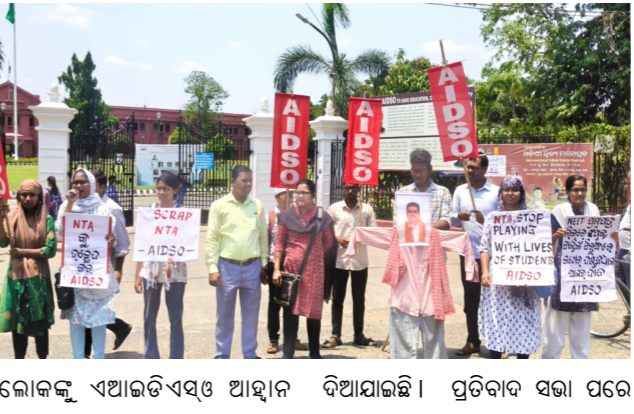
ଲୋକଙ୍କୁ ଏଆଇଡିଏସଓ ଆହ୍ଵାନ ଦିଆଯାଇଛି । ପ୍ରତିବାଦ ସଭା ପରେ

କଟକ(ନି.ପ୍ର) : ନିର୍ ବ୍ରହ୍ମ ପତ୍ର ଲିକ୍ ଘଟଣାର ବିଚାର ପରିଚାଳନା ଆଦି ଦାବିରେ ଏଆଇଡିଏସଓ କଟକ ଜିଲ୍ଲା କମିଟି ପକ୍ଷରୁ ରେଭେନ୍ସା ବିଶ୍ଵବିଦ୍ୟାଳୟ ସମ୍ମୁଖରେ ଏକ ପ୍ରତିବାଦ ସଭା ଅନୁଷ୍ଠିତ ହୋଇଯାଇଛି । ଆଗାମୀ ଦିନରେ ଏକଜୁଟ୍ ହୋଇ ସ୍ଵର ଉତ୍ତୋଳନ କରିବା ଏବଂ ଏକ ନିରପେକ୍ଷ, ଗଣତାନ୍ତ୍ରିକ ତଥା ନିର୍ଭରଯୋଗ୍ୟ ଶିକ୍ଷା ଓ ପରୀକ୍ଷା ବ୍ୟବସ୍ଥା ଦାବି କରି ଦେଖାଯାଆ ଏକ ମିଳିତ ଛାତ୍ର ଆନ୍ଦୋଳନ ଗଢ଼ି ତୋଳିବା ପାଇଁ ଛାତ୍ରଛାତ୍ରୀ, ଅଭିଭାବକ, ଶିକ୍ଷକ ସରକାର ନିଜେ ସ୍ଵଚ୍ଛତା ଏବଂ ଉତ୍ତରଦାୟିତ୍ଵର ସହ