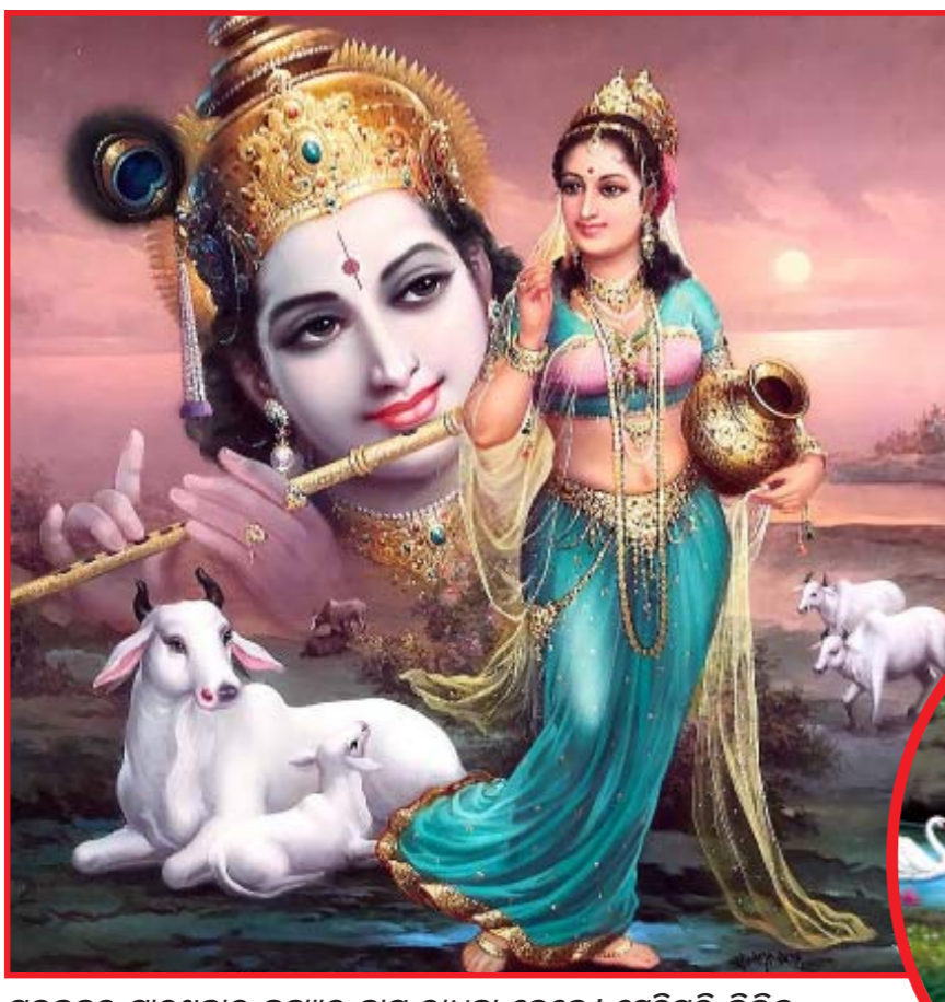
ପଦ୍ମବନରୁ ପାଇଥିବାରୁ କନ୍ୟାର ନାମ ରାଧିକା ଦେଲେ । ସେହିପରି ବିଭିନ୍ନ ଲୋକ ବିଭିନ୍ନ ନାଁ ଦେଲେ ଯେମିତି କୃଷ୍ଣଭୀରୁ ଦେଲେ ରସବତୀ, ମା କାର୍ତ୍ତିକା ଦେଲେ ବିନୋଦିନୀ, ଯୋଗମାୟାଙ୍କ ଅବତାର ପୂର୍ଣ୍ଣମାସୀ ଦେଲେ ଶ୍ରୀମତୀ, ବୃନ୍ଦାବନର ଗୋପୀ ଦେଲେ ବୃନ୍ଦାବନେଶ୍ୱରୀ । ରାଜା ରଷି ଦୁର୍ବିସାଙ୍କୁ ଡକାଇ କନ୍ୟାର ଜାତକ ତିଆରି କରାଇଲେ...