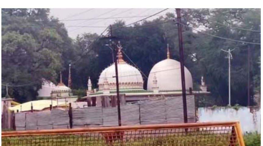
କୋର୍ଟ କହିଛନ୍ତି, 'ଆମେ ତଥ୍ୟ ଏବଂ ଏସ୍‌ଏଆଇ ଆଇନ ଯାଞ୍ଚ କରିଥିଲୁ। ପ୍ରମୁଖ ଏକ ବିଜ୍ଞାନ। ଏହାର ଆଧାରରେ ଆସିଥିବା ନିଷ୍ପତ୍ତିକୁ ବିଶ୍ୱାସ କରାଯାଇପାରିବ। ଏହା ବ୍ୟତୀତ, ସମ୍ପ୍ରଦାୟ ଅନୁଯାୟୀ ସୁନିଶ୍ଚିତ ମୌଳିକ ଅଧିକାର ଗୁଡ଼ିକୁ ମଧ୍ୟ ବିଚାର କରିବାକୁ ପଡିବ। ଏହା ପରମାର ରାଜ୍ୟ'ଗର ରାଜା ଭୋଇଙ୍କ ସମୟରେ ସଂସ୍କୃତ

ନୂଆଦିଲ୍ଲୀ, ୧୫/୫: ମଧ୍ୟପ୍ରଦେଶର ଧାର ଭୋଇଗାମା ମାମଲରେ ଇନ୍ଦୋର ହାଇକୋର୍ଟ ଏକ ଗୁରୁତ୍ୱପୂର୍ଣ୍ଣ ରାୟ ପ୍ରଦାନ କରିଛନ୍ତି। କୋର୍ଟ ବିବାଦୀୟ ସ୍ଥାନକୁ ମନ୍ଦିର ଭାବରେ ମାନ୍ୟତା ଦେଇଛି ଏବଂ କହିଛନ୍ତି ଯେ, ଏଠାରେ ହିନ୍ଦୁ ମାନଙ୍କର ପୂଜା କରିବାର ଅଧିକାର ଅଛି। ତଳିତ ମାସ ୧୨ ତାରିଖରେ ହାଇକୋର୍ଟ ଏହି ମାମଲରେ ତାଙ୍କର ନିଷ୍ପତ୍ତି ସଂରକ୍ଷିତ ରଖୁଥିଲେ। ଏବେ ଅଧିକାର ଏହି ନିଷ୍ପତ୍ତି ଉପରେ ସହର କାଳି ଖୁଲାଇ ଦାବି ଏକ ପ୍ରତିକ୍ରିୟା ଦେଇଛନ୍ତି। ସେ କହିଛନ୍ତି ଯେ, ସେ କୋର୍ଟଙ୍କ ନିଷ୍ପତ୍ତି ପଢିବେ ଏବଂ ବୁଝିବେ। ସେ ଏହା ମଧ୍ୟ କହିଛନ୍ତି ଯେ, ମୁସଲିମ୍ ପକ୍ଷ ପ୍ରତିମାକୋର୍ଟଙ୍କ ଦ୍ୱାରା ସହେଦ। ଧାର ଭୋଇଗାମା ମାମଲରେ ରାୟ ପ୍ରଦାନ କରିବା ପାଇଁ ଆଜି (ଶୁକ୍ରବାର) ହାଇକୋର୍ଟ ବେଞ୍ଚ ଏକ ବୈଠକ କରିଥିଲେ। ଏହି ସମୟରେ ବିଚାରପତି କୋର୍ଟକୁ ସହାୟତା କରିଥିବା ସମସ୍ତ ଓକିଲଙ୍କ ପ୍ରତି କୃତଜ୍ଞତା ପ୍ରକାଶ କରିଥିଲେ।