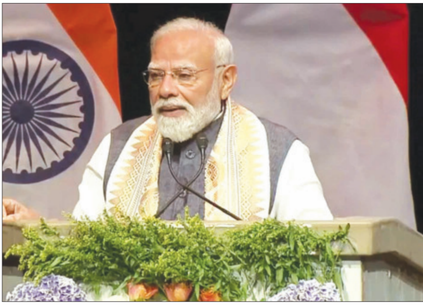
ପୂର୍ବେ, ଆମେ ମୋବାଇଲ୍ ଫୋନ୍ ଆମ ଦାନ କରୁଥିଲୁ; ଆଜି, ଭାରତ ବିଶ୍ୱର ଦୂରତା ଦୂରତା ମୋବାଇଲ୍ ନିର୍ମାତା । ଏହା ବ୍ୟତୀତ, ଆଜିର ଭାରତ ଆଉ ଏକ ସ୍ୱତନ୍ତ୍ର ପରିଚୟ ରଖିଛି: ଏହା ଏକ ନବଯୁଗର ଶକ୍ତି କେନ୍ଦ୍ର । ଆଜି, ଆମର ଡିଜିଟାଲ୍ ସାଫ୍ଟୱେର ଡିଜିଟାଲ୍ ସାଫ୍ଟୱେର ବିଶ୍ୱରେ ଆଲୋଚନା ହେଉଛି । ଏହା ଭାରତୀୟ

ନୂଆଦିଲ୍ଲୀ, ୧୬।୫: ପ୍ରଧାନମନ୍ତ୍ରୀ ନରେନ୍ଦ୍ର ମୋଦି ଯୁବପିଢ଼ିର ଦେଶ ନେତୃତ୍ୱାଧୀନତାରେ ପ୍ରଥମେ ପ୍ରଧାନ ଭାରତୀୟମାନେ ତାଙ୍କୁ ଭବ୍ୟ ସ୍ୱାଗତ କରିଥିଲେ । ନେତୃତ୍ୱାଧୀନତା ହେତୁ ଆୟୋଜିତ ଭାରତୀୟ ସମ୍ମିଳନୀରେ ସେ ସମୋ୍ଥ୍ୟ କରିଥିଲେ । ପ୍ରଧାନମନ୍ତ୍ରୀ ନରେନ୍ଦ୍ର ମୋଦି ବିଶ୍ୱକୁ ଶକ୍ତି ସଂକଟ ବିଷୟରେ ସଚ୍ଚ କରାଇଛନ୍ତି । ସେ ମତବ୍ୟ ଦେଇଥିଲେ ଯେ 'ଆଜି ମାନବଜାତି ଅନେକ ବଡ଼ ଚ୍ୟାଲେଞ୍ଜର ସମ୍ମୁଖୀନ ହେଉଛି । ପ୍ରଥମେ କରୋନା ଭାରତ ସ ଆସିଥିଲା, ତା'ପରେ ମୁକ୍ତ ହୋଇଥିଲା ଏବଂ ଏବେ ଏକ ଶକ୍ତି ସଂକଟ ଦେଖାଦେଇଛି । ଏହି ଦକ୍ଷିଣ ବିଶ୍ୱ ପାଇଁ ବିପର୍ଯ୍ୟୟର ଦଶନ୍ଧିରେ ପରିଣତ ହେଉଛି । ଯଦି ଏହି ପରିସ୍ଥିତି ଶୀଘ୍ର ପରିବର୍ତ୍ତନ ନ ହୁଏ, ତେବେ ବିଗତ ଦଶନ୍ଧିଗୁଡ଼ିକର ସଫଳତା ଲୋପ ପାଇଯାଇପାରେ । ବିଶ୍ୱ ଜନସଂଖ୍ୟାର ଏକ ଗୁରୁତ୍ୱପୂର୍ଣ୍ଣ ଅଂଶ ପୂର୍ଣ୍ଣ ଥରେ ଭାରତୀୟ ଚକ୍ରରେ ପରିଣତ ହେବ । ପ୍ରଧାନମନ୍ତ୍ରୀ ନିଜ ଦେଶର ସଫଳତାକୁ ଉଲ୍ଲେଖ କରି କହିଛନ୍ତି, 'ସାମ୍ପ୍ରତିକ ବର୍ଷଗୁଡ଼ିକରେ, ଭାରତ ପୃଥିବୀ ଏବଂ ଚନ୍ଦ୍ର ମଧ୍ୟରେ ଦୂରତା ଅପେକ୍ଷା ୧୧ ଗୁଣ ଅଧିକ ଦୂରତା ଅତିକ୍ରମ କରି ଅଧିକାଂଶ ପାଇବାର କେନ୍ଦ୍ରୀୟ ବିକାଶ । ଏକ ଦଶନ୍ଧି