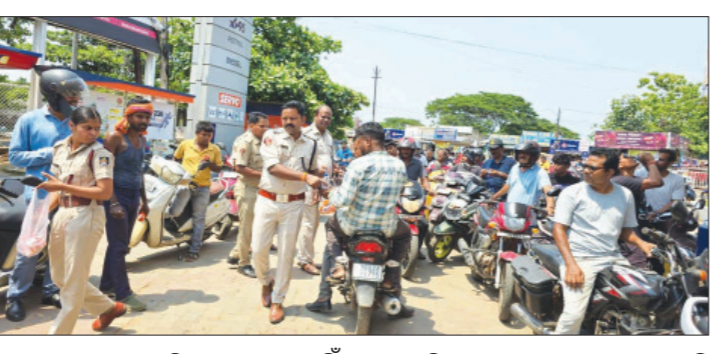
ରାଜ୍ୟରେ ପେଟ୍ରୋଲ ଓ ଡିଜେଲର ଅଭାବ ନାହିଁ । ପର୍ଯ୍ୟାପ୍ତ ପରିମାଣରେ ତେଲ ମହଙ୍ଗୁ ଅଛି । ପେଟ୍ରୋଲ ଚାଲିରେ ଭିଡ଼ ନ ଲାଗାଇବାକୁ ଅର୍ଥନୀତି

ଭୁବନେଶ୍ୱର, ୧୬।୫: ଆଜି ବି ରାଜ୍ୟର ବିଭିନ୍ନ ସ୍ଥାନରୁ ଆସିଥିବା ପେଟ୍ରୋଲ, ଡିଜେଲ ପାଇଁ ଲୋକଙ୍କ ସଂଗଠନ ଦୃଶ୍ୟ । ରାତି ପାଞ୍ଚଟା ବେଳକୁ ପେଟ୍ରୋଲ ପମ୍ପରେ ଭିଡ଼ ଲାଗିଥିଲା ବୋଲି କେତେକ ଗଣତନ୍ତ୍ର ଯୁବା ଧରି ଧାଡ଼ିରେ ରହି ରାତିରେ ତେଲ ପକାଇଥିଲେ । ଅନ୍ୟପକ୍ଷେ ଆଜି ପୁଣି ଯୋଗାଣ ମଧ୍ୟ ବୈଠକ କରିଛନ୍ତି । ରାଜ୍ୟରେ ତେଲ ଅଭାବ ନାହିଁ ବୋଲି ଦୋହଲାଇଛନ୍ତି ତେଲ କମ୍ପାନୀ ଅଧିକାରୀ । ସରକାର, ମନ୍ତ୍ରୀ, ବିଭାଗ ଓ ତୈଳ ଯୋଗାଣକାରୀ କମ୍ପାନୀ କହୁଛନ୍ତି,