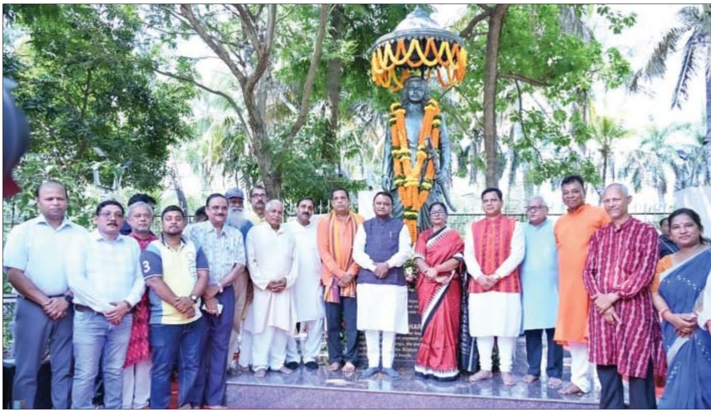
ଭୁବନେଶ୍ୱର: ବିପ୍ଳବୀ ଧରଣାଧର ଭୂୟାଁଙ୍କ ଶ୍ରୀକାନ୍ତ ଅବସରରେ ଓଡ଼ିଶା ବିଧାନସଭା ନିକଟରେ ଧରଣାଧରଙ୍କ ପ୍ରତିମୂର୍ତ୍ତିର ଶ୍ରଦ୍ଧାଞ୍ଜଳି ଅର୍ପଣ କରୁଛନ୍ତି ମୁଖ୍ୟମନ୍ତ୍ରୀ ମୋହନ ଚରଣ ମାଝୀ, ବାଚସ୍ପତି ସୁରମା ପାଢ଼ୀ ଏବଂ ଅନ୍ୟ ବିଶିଷ୍ଟ ଅତିଥିମାନେ ।