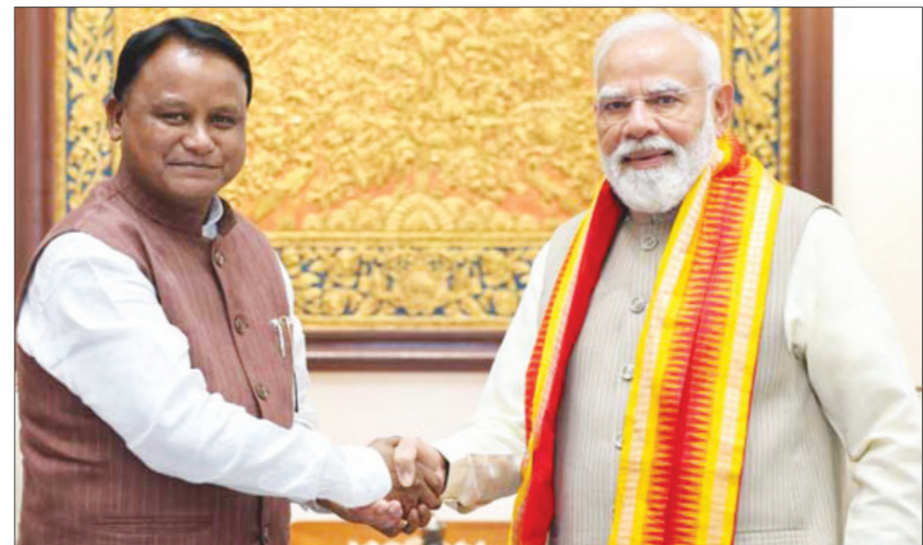
ପ୍ରଧାନମନ୍ତ୍ରୀଙ୍କୁ ଭେଟିଲେ ମୁଖ୍ୟମନ୍ତ୍ରୀ ମୋହନ ମାଝୀ

ଭୁବନେଶ୍ୱର, ୨୫ ମଇ: ଓଡ଼ିଶା ମୁଖ୍ୟମନ୍ତ୍ରୀ ମୋହନ ମାଝୀ ଆସିବାକୁ ନୂଆଦିଲ୍ଲୀରେ ପ୍ରଧାନମନ୍ତ୍ରୀ ନରେନ୍ଦ୍ର ମୋଦିଙ୍କୁ ଭେଟି ରାଜ୍ୟର ବିକାଶ କାର୍ଯ୍ୟସୂଚୀ ସହିତ ଜଡ଼ିତ ବିଭିନ୍ନ ପ୍ରସଙ୍ଗ ସମ୍ପ୍ରଦାନ କରିଛନ୍ତି।