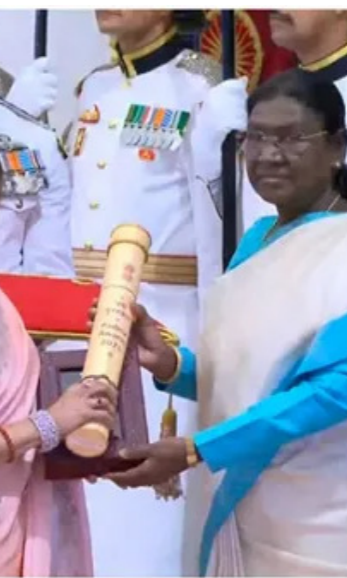
ଧର୍ମେନ୍ଦ୍ରଙ୍କୁ ପଦ୍ମ ବିଭୂଷଣ ପୁରସ୍କାର କରାଯାଇଛି।

ରାଷ୍ଟ୍ରପତି ଶ୍ରୀ ପଦ୍ମ ପୁରସ୍କାର କଳା, ସାହିତ୍ୟ, ଚିକିତ୍ସା, ବିଜ୍ଞାନ ଓ କ୍ଷେତ୍ର ସମେତ ବିଭିନ୍ନ କ୍ଷେତ୍ରରେ ଲାଭ ପ୍ରତିଷ୍ଠିତ ବ୍ୟକ୍ତିଙ୍କୁ ଦେଶର ଶାସ୍ତ୍ରୀ, ମାନବିକ ସମ୍ମାନରେ ସମର୍ଥନ କରିଛନ୍ତି।