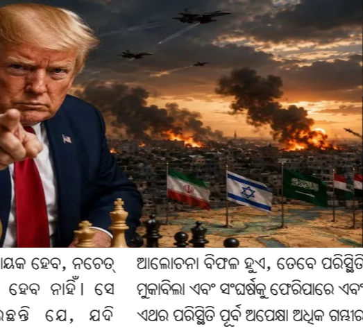
ସମସ୍ତ ସମ୍ପର୍କ ଲାଭଦାୟକ ହେବ, ନଚେତ୍ କୌଣସି ରୁଚ୍ଛିନାମା ହେବ ନାହିଁ।

ଫ୍ଲିଂଗିଂ, ୧୫: ଆମେରିକା ରାଷ୍ଟ୍ରପତି ଡୋନାଲ୍ଡ ଟ୍ରମ୍ପ ତାଙ୍କ ସୋସିଆଲ ମିଡିଆ ପ୍ଲାଟଫର୍ମ, ଟୁଥ୍ ସୋସିଆଲରେ ଭରାନ ସହିତ ଚାଲିଥିବା ଆଲୋଚନାକୁ ନେଇ ଏକ ବଡ଼ ବିକୃତି ଦେଇଛନ୍ତି।