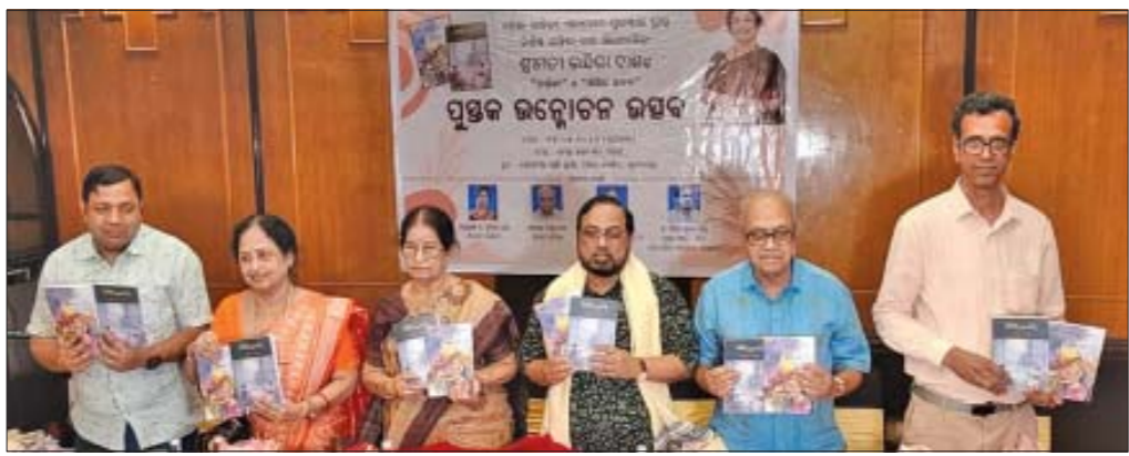
ଭୁବନେଶ୍ୱର: ବିଶିଷ୍ଟ ଗାନ୍ଧିଜୀ ଗ୍ରାମୀଣ ଉଦ୍ଦିଷ୍ଟ ଦାଖଲ 'ନର୍କା' ଓ 'ଶିଶିର କନ୍ୟା' ପୁସ୍ତକ ଉଦ୍ଘାଟନ ଉତ୍ସବରେ ଅତିଥିବୃନ୍ଦ