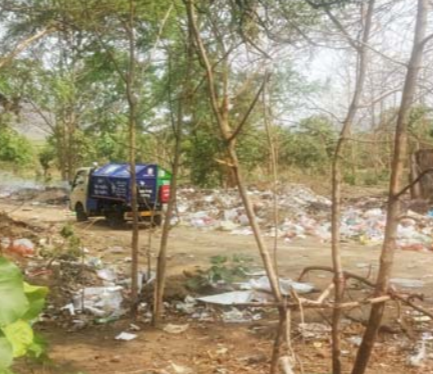
ଏପରିକି ଲୋକଙ୍କୁ ଠାରେ ପଦକ୍ଷେପ ନେହେରୁଥିବା ଅଭିଯୋଗ ହେଉଛି । ଶେଷରେ ବଲାଙ୍ଗିର ଜଙ୍ଗଲ ବିଭାଗ ପକ୍ଷରୁ ତ୍ୱିପତ୍ତ ପତ୍ରସଂଖ୍ୟା ୪୧୯୭/ତା: ୨୮.୪.୨୦୨୬ ଦିନ ବଲାଙ୍ଗିର ମ୍ୟୁନିସିପାଲିଟିର ପୌରନିର୍ବାହୀ ଅଧିକାରୀଙ୍କୁ ଚେତାବନୀ ସତ୍ତ୍ୱେ ଆବର୍ଜନା ଗଦାରେ ନିଆଁ ନ ଲାଗାଇବାକୁ ବାରଣ କରିଛନ୍ତି । ଏହା ସହ ବିକାଶମନ ତୃଷ୍ଣାଭୀର୍ତ୍ତକୁ ସମୟରେ ସ୍ଥାନୀୟ ଲୋକେ ମ୍ୟୁନିସିପାଲିଟିକୁ ନିଆଁ ଖୋଲେ ବ୍ୟାପିଯାଇ ନିକଟରେ ଥିବା

ବଲାଙ୍ଗିର, ୨୯।୫ (ନିପ୍ତ): ବଲାଙ୍ଗିର-ଟିକିଟାଲ ଟୋରା ବିକାଶମନ ଠାରେ ଥିବା ତୃଷ୍ଣାଭୀର୍ତ୍ତ ନିଆଁର ପ୍ରଭାବରେ ସ୍ଥାନୀୟ ବାସିନ୍ଦା ପ୍ରଭାବିତ ହେଉଥିବାକୁ ଚାହାନ୍ତି ଅତିଶୀଘ୍ର ସ୍ଥାନାନ୍ତର କରିବାକୁ ବଲାଙ୍ଗିର ଜଙ୍ଗଲ ବିଭାଗ ପକ୍ଷରୁ ମ୍ୟୁନିସିପାଲିଟିକୁ ନୋଟିସ ଜାରି କରାଯାଇଛି । ସୂଚନା ଅନୁଯାୟୀ, ବଲାଙ୍ଗିର-ଟିକିଟାଲ ଟୋରା ବିକାଶମନକୁ ଲାଗି ରହିଛି ବନ୍ଧା ସଂରକ୍ଷିତ ଜଙ୍ଗଲ । ଏହା ବଲାଙ୍ଗିର ଜଙ୍ଗଲ ବିଭାଗର ଅଧୀନରେ ରହିଛି । ଦୀର୍ଘବର୍ଷ ହେଲା ଏହି ଜଙ୍ଗଲର ପାଖାପାଖି ବିକାଶମନ ଠାରେ ମ୍ୟୁନିସିପାଲିଟି ପକ୍ଷରୁ ବଲାଙ୍ଗିର ସହରର ଆବର୍ଜନା ଓ ବର୍ଜବସ୍ତୁକୁ ପ୍ରାକୃତରେ ନେଇ ଘେରି ଗଦା କରାଯାଇଛି । ଏପରିକି ଆବର୍ଜନାର ପାହାଡ଼ ତିଆରି ହୋଇଗଲେ ତାକୁ ନିଆଁ ଲାଗିଯାଉଛି । ଫଳରେ ୩୪୬ଦିନ ଧରି ଉଚ୍ଚ ଆବର୍ଜନା ଜଳି ସ୍ଥାନୀୟ ଅଂଚଳରେ ଅସ୍ୱାସ୍ଥ୍ୟକର ପରିବେଶ ସୃଷ୍ଟି ହେବା ସହ ମାତୃଧିକ ଗରମ ବୃଦ୍ଧି ହେଉଛି । ଆବର୍ଜନାର ନିଆଁ ଖୋଲେ ବ୍ୟାପିଯାଇ ନିକଟରେ ଥିବା