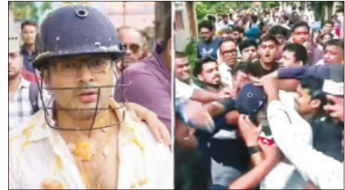
ଦେଲିଥିଲେ । ଘଟଣାସ୍ଥଳରେ ଉଭୟ କର୍ମୀ ପରିସ୍ଥିତି ସୃଷ୍ଟି ହୋଇଥିବା ବେଳେ ପୁରୁଣାକର୍ମୀ ଏବଂ ପୁଲିସ ଅଭିଷେକଙ୍କୁ ହେଲମେଟ ପିନ୍ଧାଇ

କୋଲକାତା, ୩୦।୫ : ପଶ୍ଚିମବଙ୍ଗର ସୋନାରପୁରଠାରେ ଟିଏମସି ନେତା ଅଭିଷେକ ବାନାର୍ଜୀଙ୍କୁ ଶନିବାର ଆକ୍ରମଣ ହୋଇଛି । ଜଣେ କର୍ମୀଙ୍କ ଘରକୁ ସେ ଯାଇଥିବା ସମୟରେ ଏଭଳି ଘଟଣା ଘଟିଥିଲା । ବାଟରେ କିଛି ଲୋକ ତାଙ୍କୁ ବିରୋଧ କରିବା ସହ ନାରାବାଜି କରିଥିଲେ । ତାଙ୍କ ଉପରକୁ ଅଣ୍ଟା ଓ ଚେକା ମାରିବା ସହ ଯୋଷାକ ଭିଡି ଦେଇଥିଲେ ।