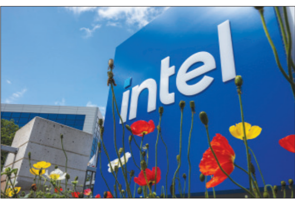
ପାଇଁ ଓଡ଼ିଶା ସରକାର ଏବଂ କେନ୍ଦ୍ର କର୍ପୋରେସନ ଓ ମା ଡିଜିଏସ ଆଇଏନସି ମଧ୍ୟରେ ହୋଇଥିବା ଚୁକ୍ତିନାମା ପ୍ରାୟ ୨୭ ହଜାର କୋଟି ଟଙ୍କାର ପୁଞ୍ଜିନିଯୋଗରେ ଇଣ୍ଟେଲ ଭାରତର କାରଖାନା ଖୋଲିବା ନିମନ୍ତେ ଇଣ୍ଟେଲ-ଭାରତ ଓ ଓଡ଼ିଶା ସରକାରଙ୍କ ମଧ୍ୟରେ ଚୁକ୍ତି ହୋଇଛି । ଆମେରିକାର ଇଣ୍ଟେଲ ମୁଖ୍ୟାଳୟରୁ ମୁଖ୍ୟମନ୍ତ୍ରୀଙ୍କ ସହିତ ଯାଇ ଡ୍ଵିତି ଅନୁଧ୍ୟାନ କରିଛନ୍ତି । ଭୁବନେଶ୍ଵର-ଖୋର୍ଦ୍ଧା ଅଞ୍ଚଳରେ ଏକ ଆଡ଼ଭାନ୍ସ ପ୍ୟାକେଜିଂ ଗ୍ରାସ କୋରସବିଷୟକ ମ୍ୟାକ୍ରୋ-ପ୍ରକ୍ରିୟାକରଣ କେନ୍ଦ୍ର ସ୍ଥାପନ

ଭୁବନେଶ୍ଵର, ୩୦।୫ (ନିପ୍): ବିଶ୍ଵରାଜ୍ୟ ଆଇଟି କମ୍ପାନୀ ଇଣ୍ଟେଲର ଭାରତର ଓଡ଼ିଶାରେ ପ୍ରଥମ ଯୁନିଟ ଗଠନ ହେବାକୁ ଯାଉଛି । ସେଥିପାଇଁ ତ୍ରିପାଠିକ ଚୁକ୍ତିନାମା ସ୍ଵାକ୍ଷରିତ ହୋଇଛି । ଭୁବନେଶ୍ଵରରେ ସେମି କଣ୍ଠକୃତ ପ୍ୟାକେଜିଂ ଯୁନିଟ ଇଣ୍ଟେଲ ଖୋଲିବ । ରାଜ୍ୟରେ ଆଇଟି ସେକ୍ଟରରେ ଇକୋ ସିଷମ ବୃଦ୍ଧି ପାଇବ । ପ୍ରାୟ ୨୭ ହଜାର କୋଟି ଟଙ୍କାର ପୁଞ୍ଜିନିଯୋଗରେ ଇଣ୍ଟେଲ ଭାରତର କାରଖାନା ଖୋଲିବା ନିମନ୍ତେ ଇଣ୍ଟେଲ-ଭାରତ ଓ ଓଡ଼ିଶା ସରକାରଙ୍କ ମଧ୍ୟରେ ଚୁକ୍ତି ହୋଇଛି । ଆମେରିକାର ଇଣ୍ଟେଲ ମୁଖ୍ୟାଳୟରୁ ମୁଖ୍ୟମନ୍ତ୍ରୀଙ୍କ ସହିତ ଯାଇ ଡ୍ଵିତି ଅନୁଧ୍ୟାନ କରିଛନ୍ତି । ଭୁବନେଶ୍ଵର-ଖୋର୍ଦ୍ଧା ଅଞ୍ଚଳରେ ଏକ ଆଡ଼ଭାନ୍ସ ପ୍ୟାକେଜିଂ ଗ୍ରାସ କୋରସବିଷୟକ ମ୍ୟାକ୍ରୋ-ପ୍ରକ୍ରିୟାକରଣ କେନ୍ଦ୍ର ସ୍ଥାପନ