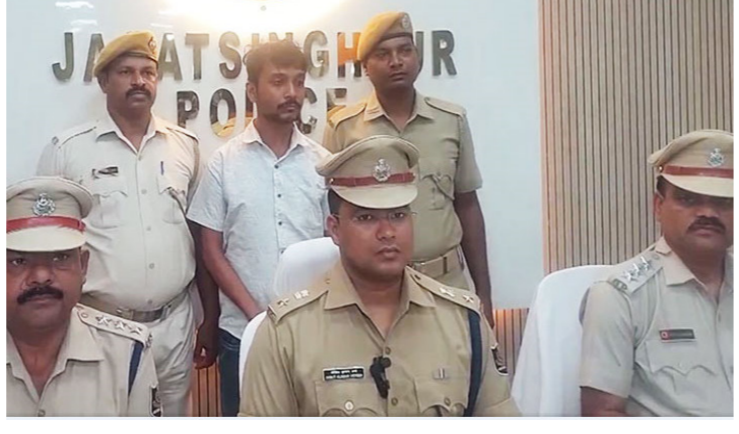
ଜଗତସିଂହପୁର, (ନିପ୍ତ): ଜଗତସିଂହପୁର ରୁ ସ୍ତ୍ରୀ କ୍ୟାମେରା ଜବତ ଘଟଣାରେ ପୋଲିସ୍ ପକ୍ଷରୁ କାର୍ଯ୍ୟାନୁଷ୍ଠାନ ଗ୍ରହଣ କରାଯାଇଛି ।