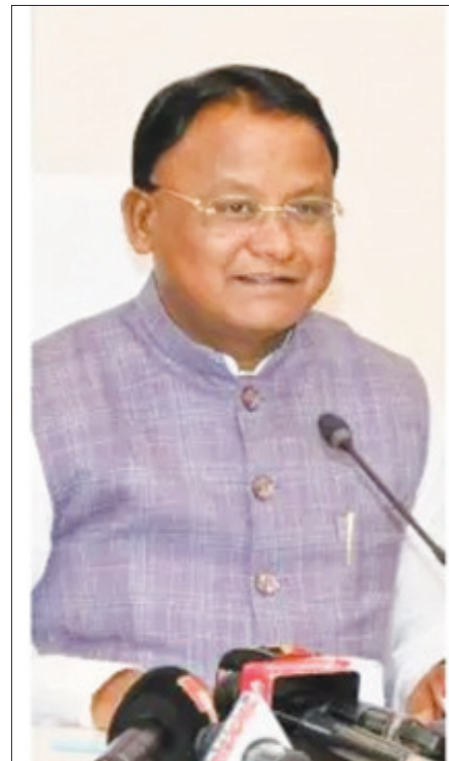
ଭୁବନେଶ୍ୱର, ୨୬ (ନିପ୍ତ): ଭବିଷ୍ୟତ ୨୦୨୬-୨୭ ଶିକ୍ଷା ବର୍ଷରୁ ଇଞ୍ଜିନିୟରିଂ ଓ ମେଡିକାଲ୍ ଆଦି ବୈଷୟିକ ଶିକ୍ଷା କ୍ଷେତ୍ରରେ ଅନୁସୂଚିତ ଜନଜାତି ଓ

ଅନୁସୂଚିତ ଜାତି ତଥା ସାମାଜିକ ଓ ଶିକ୍ଷାଗତ ପଛୁଆ ବର୍ଗର ଛାତ୍ରଛାତ୍ରୀଙ୍କ ପାଇଁ ସଂରକ୍ଷଣ ବୃଦ୍ଧି ସମ୍ପର୍କିତ ନିଷ୍ପତ୍ତି କାର୍ଯ୍ୟକାରୀ ହେବ । ମଙ୍ଗଳବାର ଏ ସମ୍ପର୍କରେ ଅନୁସୂଚିତ ଜନଜାତି ଓ ଅନୁସୂଚିତ ଜାତି ଉନ୍ନୟନ, ସଂଖ୍ୟାଲଘୁ ସମ୍ପ୍ରଦାୟ ଓ ପଛୁଆ ବର୍ଗ କଲ୍ୟାଣ ବିଭାଗ ପକ୍ଷରୁ ବିଧିବଦ୍ଧ ସ୍ତରୀକ (ମେମୋରାଣ୍ଡମ) ପ୍ରକାଶ ପାଇଛି । ଏହି ନିଷ୍ପତ୍ତି ଦ୍ୱାରା