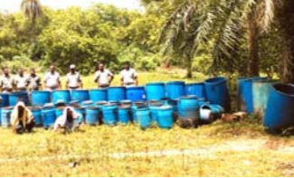
ଆକଳନ କରାଯାଇଥିଲା । ଏହା ସହିତ ଆସବାବପତ୍ର ଜବତ କରାଯାଇ ଘଟଣା ସ୍ଥଳରେ ହିଁ ନଷ୍ଟ କରାଯାଇଥିଲା ।