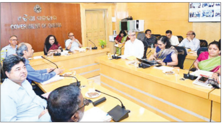
କୋଟି ଟଙ୍କା ବିନିଯୋଗ ସହିତ ଖୋର୍ଦ୍ଧାରେ ଏକ ଲାଭୋପାୟକ ଉପକ୍ରମ ଯୋଜନା ଉପରେ ଆଲୋଚନା ହେଉଛି ।

ଆଣ୍ଡା କରାଯାଇଛି । ମୂଲ୍ୟ ପାଇଥିବା ଶିଳ୍ପ ପ୍ରକଳ୍ପ ଶିଳ୍ପ ପ୍ରସାର ଏବଂ ନିୟୁକ୍ତି ପୂର୍ଣ୍ଣ ଦିଗରେ ଏକ ସୁରୁତ୍ୱପୂର୍ଣ୍ଣ ପଦକ୍ଷେପ ଭାବେ ବିବେଚନା କରାଯାଇଛି ।