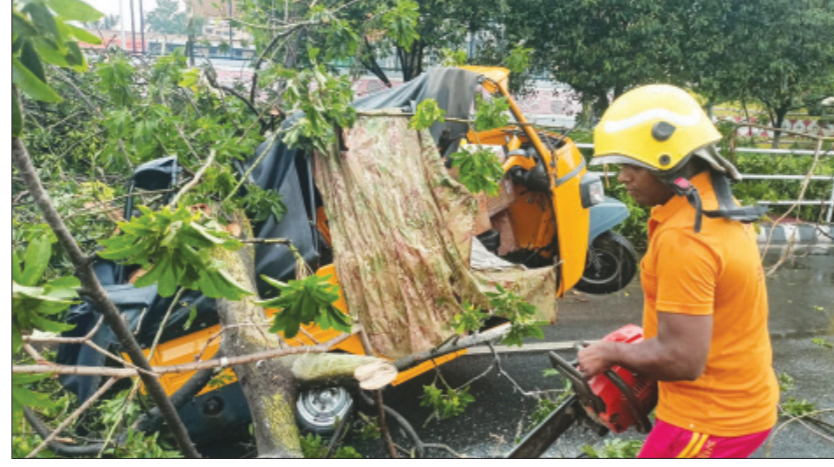
ତାପମାତ୍ରା ୩୩ ଡିଗ୍ରୀ ଓ ଆର୍ଦ୍ରତା ୭୬ ପ୍ରତିଶତ ଥିଲା । ଅପରାହ୍ଣରେ ଆକାଶରେ କଳାହଣ୍ଡିଆ ମେଘ ଦେଖାଯିବା ସହ କାଳବୈଶାଖୀ ପ୍ରଭାବରେ ଝଟତୋପାନ ବର୍ଷା ହେବ ।

ଭୁବନେଶ୍ୱର, ୬।୬: ରାଜଧାନୀ ଭୁବନେଶ୍ୱରରେ ଶନିବାର ଅପରାହ୍ଣ ପ୍ରାୟ ୩ ଘଣ୍ଟାରେ ମାଡ଼ି ଆସିଥିଲା କାଳବୈଶାଖୀ ।