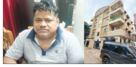
ଆୟବହିର୍ଭୂତ ସମ୍ପତ୍ତି ଠୁଳ ଅଭିଯୋଗରେ କର୍ମଚାରୀଙ୍କୁ ଠାବ ହେଲା ।

ଭୁବନେଶ୍ୱର, ୬।୬: ଆୟବହିର୍ଭୂତ ସମ୍ପତ୍ତି ଠୁଳ ଅଭିଯୋଗରେ କର୍ମଚାରୀଙ୍କୁ ଠାବ ହେଲା ।