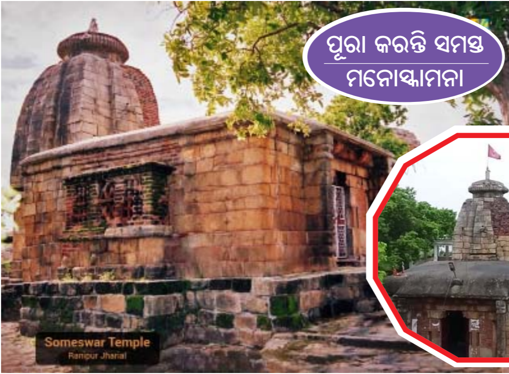
ପୂରା କରନ୍ତି ସମସ୍ତ ମନୋହାମନା

ଓଁ, ମର ଓ ଯଶର ପୀଠ ବଳାଙ୍ଗିର ଜିଲ୍ଲାର ରାଣାପୁର । ସର୍ବଧର୍ମ ସମନ୍ୱୟରେ ନବମ ଶତାବ୍ଦୀରେ ଗଠି ଉଠିଥିଲା ରାଣାପୁର ଝରିଆଳ ପୀଠ । ବିରାଟକାୟ ଲକ୍ଷ୍ମୀ ପାହାଚ ଚଟାଣରେ ରହିଛି ସୋମେଶ୍ୱର ବାବାଙ୍କ ମନ୍ଦିର । ପଶ୍ଚିମ ଓଡ଼ିଶାର ଅନେକ ଶୈବପୀଠ ମଧ୍ୟରୁ ସୋମେଶ୍ୱର ବାବାଙ୍କ ପୀଠ ବହୁ ପୁରୁଣା । ବାବାଙ୍କ ଦର୍ଶନ ପାଇଁ ରାଜ୍ୟ ତଥା ରାଜ୍ୟ ବାହାରୁ ଶ୍ରଦ୍ଧାଳୁଙ୍କ ଭିଡ ଜମେ । ବଳାଙ୍ଗିର ଜିଲ୍ଲା ବଙ୍ଗୋପୁଷ୍ପା ବୃକ୍ଷ ରାଣାପୁର ଝରିଆଳରେ ପୂଜା ପାଉଛନ୍ତି ବାବା ସୋମେଶ୍ୱର । ସର୍ବଧର୍ମ ସମନ୍ୱୟରେ ନବମ ଶତାବ୍ଦୀରେ ଗଠି ଉଠିଥିବା ଏହି ପୀଠରେ ପୂଜା ପାଉଛନ୍ତି ସୋମେଶ୍ୱର ମହାଦେବ । ସୋମେଶ୍ୱରୀ ରାଜାମାନେ ଏହି ଭବ୍ୟ ମନ୍ଦିର ନିର୍ମାଣ କରିଥିବା ଜଣାଯାଏ । ମନ୍ଦିର ନିକଟରେ ଏକ ପୁଷ୍କରିଣୀ ଅଛି । ସମିଆ ବନ୍ଧ ନାମରେ ନାମିତ ଏହି ପୋଖରୀରେ ଏକ ସୁତଙ୍ଗ ଅଛି । ଏହି ସୁତଙ୍ଗ ଚିତ୍ରକାରତ କୁମୁତୀ ପାହାଚ ନିକଟସ୍ଥ ପ୍ରସିଦ୍ଧ ଧବଳେଶ୍ୱର ବାବାଙ୍କ ପୀଠକୁ ଲାସିଥିବା ବିଶ୍ୱାସ କରାଯାଏ । ସୋମେଶ୍ୱର ମନ୍ଦିରର କାରୁକାର୍ଯ୍ୟ ନିଆରା । ଏହି ମନ୍ଦରରେ ଥିବା ଏକ ପ୍ରାଚୀନ ଶିଳାଲେଖକୁ