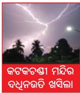
କଟକବନ୍ଧା ମନ୍ଦିର ବଦଳୁଥିବା ଦେଖିଲା

କଟକ, ୭।୬ (ନିପୁ) : କଟକରେ କାଳବୈଶାଖୀ ବର୍ଷା ସହ ଘଟଣାଟି । ଝଟ ପବନରେ ମା' କଟକବନ୍ଧା ମନ୍ଦିର ଉପରେ ବଜ୍ରପାତ ଯୋଗୁଁ ମନ୍ଦିରରୁ ପଥର ଖସିଥିବା ଦେଖିବାକୁ ମିଳିଛି । ବଜ୍ରପାତ ଯୋଗୁଁ ମନ୍ଦିର ଶିଖରରେ ଫାଟ ସୃଷ୍ଟି ହୋଇଛି । କଟକର ଅନେକ ସ୍ଥାନରେ ଝଟତୋଫାନ କାରଣରୁ ରାସ୍ତାକଡ଼ରେ ବଡ଼ବଡ଼ ଗଛ ତାଳ ଭାଙ୍ଗି ପଡ଼ିଛି । ସେହିପରି ହୋର୍ଡିଂକୁ ଷ୍ଟିଟି ପଛପାଖରେ ବେଳେ ବର୍ଷା ମଧ୍ୟ ଜନଜୀବନକୁ ପ୍ରଭାବିତ କରିଛି । କାଳବୈଶାଖୀ ଯୋଗୁଁ ଅନେକ ସ୍ଥାନରେ ବଡ଼ବଡ଼ ଗଛ ତାଳ ଭାଙ୍ଗି ରାସ୍ତା ଉପରେ ପଡ଼ିଛି । ଓପାପରି କନ୍ଦରପୁର ଜାତୀୟ ରାଜପଥରେ ପଡ଼ିଥିବା ଏକାଧିକ ଗଛ । ଯାତାଯାତ ବାଧାପ୍ରାପ୍ତ ହେବାକୁ ଗଛ ଖଣି ରାସ୍ତା ସଫା କରିବାକୁ ଅଗ୍ନିଶମ ବାହିନୀର ଉଦ୍ୟମ କରିଥିଲେ । କେତେକ ସ୍ଥାନରେ ଯାତାଯାତ ବାଧାପ୍ରାପ୍ତ ହୋଇଥିବା ବେଳେ ବିଦ୍ୟୁତ୍ ତାର ଷ୍ଟିଟିଗୁଡ଼ିକ ହେବାକୁ ପ୍ରାୟ ଅଞ୍ଚଳରେ ବିଦ୍ୟୁତ୍ ସରବରାହ ବନ୍ଦିକୁ ହୋଇଛି । ସମସ୍ତ ସମୟରେ ବର୍ଷା ପାଇଁ ପରିବେଶ ଥଣ୍ଡା ହେବା ସହ ସୁଲୁସୁଲିଆ ପବନ କଟକ ସହରବାସୀଙ୍କୁ ଶାନ୍ତି ପ୍ରଦାନ କରିଛି । କଟକରେ ଦିନର ତାପମାତ୍ରା ୩୮ ଡିଗ୍ରୀ ରେକର୍ଡ ହୋଇଥିବା ବେଳେ ବର୍ଷା ହେବା ପରେ କଟକର ତାପମାତ୍ରା ୨୮ ଡିଗ୍ରୀରେ ପହଞ୍ଚିଛି ।