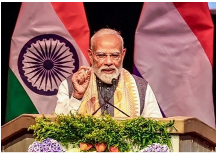
ତଥା ଅବହେଳିତ କଲ୍ୟାଣ ରହିଛି । ଆମେ ହୋଇଛୁ ଏବଂ ଆମର ପ୍ରୟାସ ସର୍ବଦା ଏହା ସୁନିଶ୍ଚିତ କରିବା ଯେ ବିକାଶର ଲାଭ ଦଶକ୍ଷି ଧରି

ନୂଆଦିଲ୍ଲୀ, ୮:୬: ପ୍ରଧାନମନ୍ତ୍ରୀ ନରେନ୍ଦ୍ର ମୋଦି ସୋମବାର ପ୍ରଧାନମନ୍ତ୍ରୀ ଗରିବ କଲ୍ୟାଣ ଯୋଜନାର ୧୨ତମ ବାର୍ଷିକୀ ଉପଲକ୍ଷେ ସରକାରଙ୍କ ବିଭିନ୍ନ ଯୋଜନାର ଲାଭ ଏବଂ ଏହା ସାଧାରଣ ଲୋକଙ୍କ ପାଖରେ କିପରି ପହଞ୍ଚିଛି ତାହା ଉପରେ ଗୁରୁତ୍ୱରୋପ କରିଛନ୍ତି । ସୋସିଆଲ ମିଡିଆ ପ୍ଲାଟଫର୍ମ ଏବଂ ଯୋଗାଣରେ ପ୍ରଧାନମନ୍ତ୍ରୀ ମୋଦି ଅତ୍ୟାଧିକ ଯୋଜନା, ସୁଦ୍ଧା ଭାରତ ମିଶନ, ପ୍ରଧାନମନ୍ତ୍ରୀ ଆବାସ ଯୋଜନା, ଜଳ ଜୀବନ ମିଶନ, ଆୟୁଷ୍ମାନ ଭାରତ ଏବଂ ଅନ୍ୟାନ୍ୟ ପଦକ୍ଷେପର ପ୍ରମୁଖ ସଫଳତା ଉପରେ ଗୁରୁତ୍ୱରୋପ କରି କହିଛନ୍ତି, ଏହି ସମସ୍ତ ଯୋଜନା ଆରମ୍ଭ କରିବାର ପ୍ରାଥମିକ ଉଦ୍ଦେଶ୍ୟ ହେଉଛି ଲୋକଙ୍କୁ ସମ୍ମାନ ଏବଂ ସୁଯୋଗ ପ୍ରଦାନ କରିବା । ପ୍ରଧାନମନ୍ତ୍ରୀ ମୋଦି କହିଛନ୍ତି, ଗତ ୧୨ ବର୍ଷ ମଧ୍ୟରେ ଭାରତ ଅନେକ ବଡ଼ ପରିବର୍ତ୍ତନ ଦେଖିଛି, ଏବଂ ଏହି ପରିବର୍ତ୍ତନର ମୂଳକର ଗରିବ