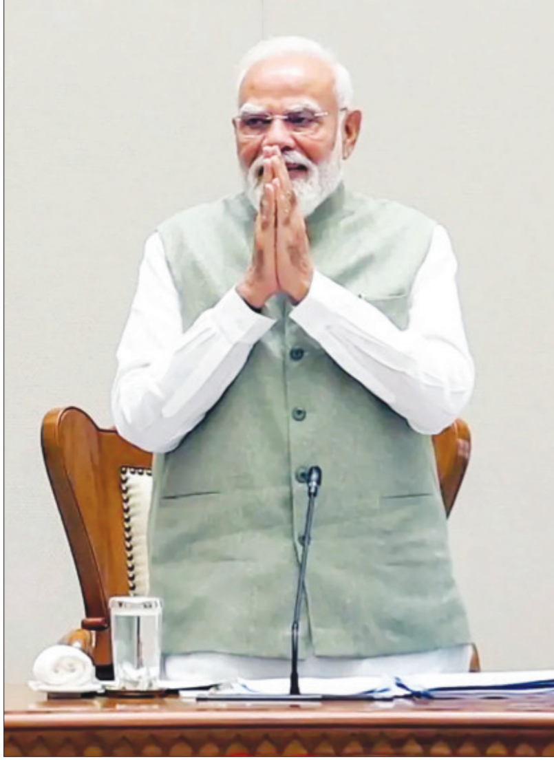
ନୂଆଦିଲ୍ଲୀ, ୧୦।୬: ଭାରତୀୟ ଗଣତାନ୍ତ୍ରିକ ଇତିହାସରେ ନିପିବନ୍ଧ ହୋଇ ରହିବ କୁନା ନାମରେ କରାଯାଇଥିବା ପ୍ରଧାନମନ୍ତ୍ରୀ ନରେନ୍ଦ୍ର ମୋଦି । ୧୦ ତାରିଖ । ଭାରତର ସବୁଠାରୁ ଦୀର୍ଘ ସମୟ

ନେହେରୁଙ୍କ ପ୍ରାୟ ୬ ଦଶନ୍ଧି ପୁରୁଣା ରେକର୍ଡ ଭାଙ୍ଗିଛନ୍ତି ପ୍ରଧାନମନ୍ତ୍ରୀ ମୋଦି । ପ୍ରଧାନମନ୍ତ୍ରୀ ନରେନ୍ଦ୍ର ମୋଦି, କୁନା ୧୦ ତାରିଖରେ ଭାରତର ପ୍ରଧାନମନ୍ତ୍ରୀ ଭାବରେ ଲଗାତାର ୪,୩୯୯ ଦିନ ପୂରଣ କରିଛନ୍ତି । ଦେଶର ପ୍ରଥମ ଗଣତାନ୍ତ୍ରିକ ସାଧାରଣ ନିର୍ବାଚନ ପରେ ଜବାହରଲାଲ ନେହେରୁଙ୍କ ଲଗାତାର କାର୍ଯ୍ୟକାଳ ୪,୩୯୮ ଦିନ ଥିଲା । ଭାରତର ପ୍ରଧାନମନ୍ତ୍ରୀଙ୍କ ଇତିହାସ ଏବଂ ଅବଦାନକୁ ସଂରକ୍ଷଣ କରୁଥିବା ପ୍ରଧାନମନ୍ତ୍ରୀ ସଂଗ୍ରହାଳୟ ରେକର୍ଡରେ ଏହା ଏକ ଐତିହାସିକ ଏବଂ ଅତୁଟପୂର୍ବ ସଫଳତା ଭାବରେ ଲିପିବଦ୍ଧ ହୋଇଛି । ପ୍ରଧାନମନ୍ତ୍ରୀ ନରେନ୍ଦ୍ର ମୋଦି ଏବେ ଦେଶର ସବୁଠାରୁ ଦୀର୍ଘ ସମୟ ଧରି ନିର୍ବାଚିତ ପ୍ରଧାନମନ୍ତ୍ରୀ ହୋଇଛନ୍ତି । ସେ ପ୍ରଥମ ଥର ପାଇଁ ୨୬ ମେ ୨୦୧୪ରେ ପ୍ରଧାନମନ୍ତ୍ରୀ ଭାବରେ ଶପଥ ନେଇଥିଲେ ଏବଂ ସେବେଠାରୁ ଆଜି ପର୍ଯ୍ୟନ୍ତ ଲଗାତାର ୪,୩୯୯ ଦିନ ଧରି ଏହି ପଦବୀରେ ଅଛନ୍ତି । ସଦକା ସାଥ, ସଦକା ବିକାଶ, ସଦକା ବିଶ୍ୱାସର ନୀତି ଦେଇ ଦେଶବାସୀଙ୍କ ମନ ଜିତିଛନ୍ତି ମୋଦି । ବିଭିନ୍ନ ସ୍ଥାନରେ ମୋଦିଙ୍କ ନାଁରେ ହୋଇଛି ପୂଜାପାଠ ସହ ହୋମଯଜ୍ଞ । ଏଭଳି ବିରଳ ଉପଲକ୍ଷ ପାଇଁ ପ୍ରଧାନମନ୍ତ୍ରୀ ମୋଦିଙ୍କୁ କ୍ୟାବିନେଟ ସହଯୋଗୀମାନେ ଠିଆ ହୋଇ ଜଣାଇଥିଲେ ଶୁଭେଚ୍ଛା ଓ ଶୁଭକାମନା । ସେଥିପାଇଁ ମିଡ଼ିଆରେ ପୋଷ୍ଟ ସେୟାର କରି ପ୍ରଧାନମନ୍ତ୍ରୀ ଲେଖିଛନ୍ତି, ବିନପ୍ରତା, ସର୍ପପତା, କର୍ତ୍ତବ୍ୟନିଷ୍ଠା ସହ ନିରନ୍ତର