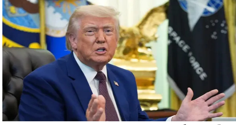
ଏହାର ଜବାବରେ ତ୍ରାମ୍ପ ମାଡ଼ ହୋଇଥିଲା । ଏହାର ଜବାବରେ ଏହି କାର୍ଯ୍ୟାନୁଷ୍ଠାନ ପାଇଁ ନିଷ୍ପତ୍ତି

ନିଆଯାଇଛି । ଆମେରିକାର ଆକ୍ରମଣ ପରେ ଇରାନ ମଧ୍ୟ ପାଲଟା ଆକ୍ରମଣ କୋର କରିଛି । ତୁରକ୍ ଦେଶ ମଧ୍ୟରେ ବର୍ତ୍ତମାନ ଘଟଣା ଚଳିଥିବା ପୂର୍ବ ମଧ୍ୟପ୍ରାନ୍ତରେ ଅସୁରକ୍ଷିତ ପରିବେଶ ସୃଷ୍ଟି କରିଛି । ଇରାନ ପକ୍ଷରୁ ବାହାରିବା ଏବଂ କୁଏଟ୍ ଅନେକ ସ୍ଥାନକୁ ଚାର୍ଜେ କରାଯାଇଛି, ଯାହା ସହ ଦୁଇ ଦେଶରେ ଆଲର୍ଟ କାରି କରାଯାଇଛି । ବାୟୁ ପ୍ରତିରକ୍ଷା ପ୍ରଣାଳୀକୁ ଆକ୍ରମଣ କରିଦିଆଯାଇଛି ଏବଂ ପୁରୁଷା ଏକକ୍ସପ୍ଲୋଜିଭ୍ ହାକ ଆଲର୍ଟରେ ରଖାଯାଇଛି ।