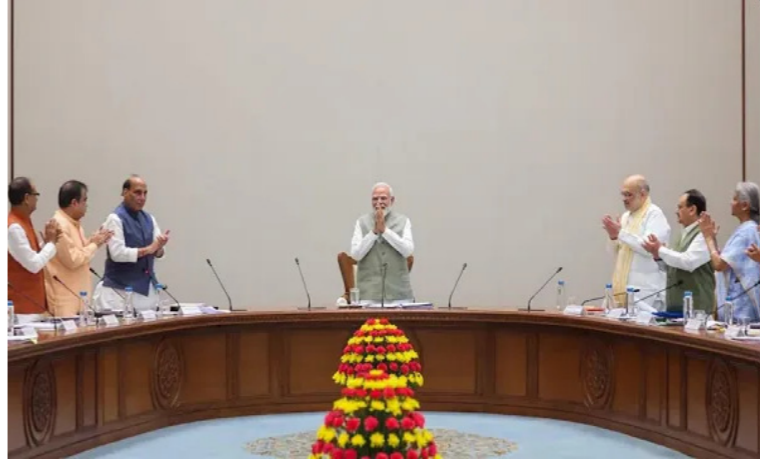
ନିଉ ଦିଲ୍ଲୀ: ଏନଡିଏ ସରକାରଙ୍କ ମଧ୍ୟରେ ଉନ୍ନତ ଯୋଗାଯୋଗ ସ୍ଥାପନ ହୋଇପାରିବ । କ୍ୟାବିନେଟ ବୈଠକ ଉପରେ ପ୍ରକଳ୍ପର ଦେଖ

ମେଟ୍ରୋ ରେଳ ପ୍ରକଳ୍ପ ସମ୍ପର୍କରେ ପାଇଁ ପ୍ରାୟ ୨,୧୬୯ କୋଟି ଖର୍ଚ୍ଚ ହେବ ବୋଲି ଆକଳନ କରାଯାଇଛି । ଏହା ପ୍ରାୟ ୨୫୦୦ ଲୋକଙ୍କ ପାଇଁ ନିଯୁକ୍ତି ମଧ୍ୟ ସୃଷ୍ଟି କରିବ ।