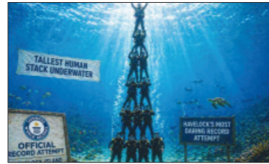
ଆଖ୍ୟାମାନଙ୍କ ଦଳ ୭୩ ଫୁଟ (୨୨.୩ ମିଟର) ଉଚ୍ଚତା ବିଶିଷ୍ଟ ଜଳମଗ୍ନ ମଣିଷଙ୍କ ଗଭୀର ତିଆରି ହୋଇଥିଲା । ଏହି ପ୍ରୟାସ ପ୍ରସିଦ୍ଧିତ ଲାଲବନ୍ଧାଉସ ଏବଂ ଡାଇଭିଂ ସାଇଟରେ ହୋଇଥିଲା ଏବଂ ଜଳମଗ୍ନ

ନୂଆଦିଲ୍ଲୀ, ୧୦।୬: ଆଖ୍ୟାମାନ ଏବଂ ନିକଟବର୍ତ୍ତୀ ଦ୍ୱାପପୁଞ୍ଜ ସବୁଠାରୁ ଉଚ୍ଚ ଜଳମଗ୍ନ ମାନବ ଚାଷ୍ଟ୍ରର ପାଇଁ ଗିନିଜ୍ ବିଶ୍ୱ ରେକର୍ଡ ସ୍ଥାପନ କରିଛି । ଏହି ରେକର୍ଡ ହାତୀର ଦ୍ୱାପର ସୁରାଜ ଦ୍ୱାପରେ ହୋଇଥିଲା ଯେଉଁଠାରେ ସୁବା ବୁଡ଼ାଳିମାନଙ୍କର ଏକ