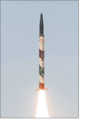
ତରୁ।ବଧାନରେ ଏହି ପରୀକ୍ଷଣ ହୋଇଥିଲା । ମିସାଇଲିଟି ସମସ୍ତ ବୈଷ୍ଣବିକ ପ୍ରତିରକ୍ଷା ମନ୍ତ୍ରାଳୟର ଅଧୀନରେ ଥିବା ସ୍ୱାତନ୍ତ୍ରିକ ଫୋର୍ସେସ୍ କମାଣ୍ଡର ପ୍ରତ୍ୟକ୍ଷ

ବାଲେଶ୍ୱର, ୧୦।୬: ବାଲେଶ୍ୱର ଚାନ୍ଦିପୁର କ୍ଷେପଣାସ୍ତର ପରୀକ୍ଷଣ କେନ୍ଦ୍ର ଲକ୍ଷ ଯାତ୍ର-୩ରୁ କ୍ଷେପଣାସ୍ତର ପରୀକ୍ଷଣ ହୋଇଛି । ଚାନ୍ଦିପୁର ଅପରାହ୍ନ ୩.୫୦ରେ ଏହି ଗୁରୁତ୍ୱପୂର୍ଣ୍ଣ ଉତ୍ତ୍ରେପଣ ହୋଇଥିଲା । କ୍ଷେପଣାସ୍ତର ପରୀକ୍ଷଣ ପାଇଁ ଲକ୍ଷ ଯାତ୍ରରୁ ୧୨୩.୫ କିଲୋମିଟର ମଧ୍ୟରେ ଲୋକଙ୍କୁ ସ୍ଥାନାନ୍ତର କରାଯାଇଥିଲା । ପ୍ରାୟ ୧୧ ହଜାର ୪୪୨ ଜଣଙ୍କୁ ଜିଲ୍ଲା ପ୍ରଶାସନ ପସରୁ ସ୍ଥାନାନ୍ତର କରାଯାଇଥିଲା । ଏଥିପାଇଁ ପୋଲିସ୍ ପ୍ରଶାସନ ପସରୁ ମଧ୍ୟ ସୁରକ୍ଷା ବ୍ୟବସ୍ଥା କରାଯାଇଥିଲା । ସୁତନାଯୋଗ୍ୟ, ଗତମାସ ଚାନ୍ଦିପୁରରୁ ଗର୍ଭିତା 'ଅଗ୍ନି-୧' ଚାନ୍ଦିପୁର ସମନ୍ୱିତ ଚେଷ୍ଟାରେ 'କରୁ' ସ୍ୱଳ୍ପ ପୁରଗାମୀ ବାଲିଷ୍ଠିକ କ୍ଷେପଣାସ୍ତର 'ଅଗ୍ନି-୧' ର ସଫଳ ପରୀକ୍ଷଣ ହୋଇଥିଲା । ମିସାଇଲିଟି ସମସ୍ତ ବୈଷ୍ଣବିକ ପ୍ରତିରକ୍ଷା ମନ୍ତ୍ରାଳୟର ଅଧୀନରେ ଥିବା ସ୍ୱାତନ୍ତ୍ରିକ ଫୋର୍ସେସ୍ କମାଣ୍ଡର ପ୍ରତ୍ୟକ୍ଷ