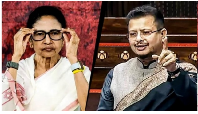
କୋଲକାତା, ୧୮:୬: ପୁଣି ମମତା ବାନାର୍ଜୀଙ୍କୁ ହାଇକୋର୍ଟରୁ ବଡ଼ ଝଟକା ଲାଗିଛି ।