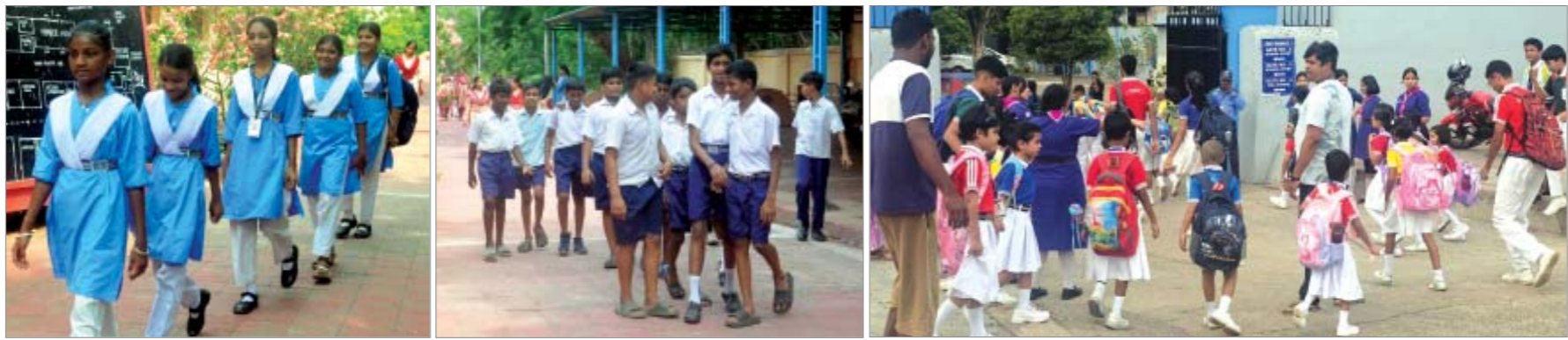
ଭୁବନେଶ୍ୱର: ଗ୍ରୀଷ୍ମଋତୁ ପରେ ସ୍କୁଲ ଖୋଲିଲା, ପ୍ରଥମ ଦିନରେ ପିଲାଙ୍କ ମଧ୍ୟରେ ସ୍କୁଲ ଯିବାର ଉତ୍ସାହ (ଫଟୋ-ଦିନିକି)

ନିତ୍ୟୋକ ନାବାଳିକା ଉଦ୍ଧାର କାକଟପୁର, ୧୮/୭(ନିପ୍ତ): କାକଟପୁର ଥାନା ପୋଲିସ୍‌ଠାରୁ ଏକ ବଡ଼ ସଫଳତା । ପୋଲିସ୍‌ର ତଦନ୍ତରେ ଯୋଗୁଁ ମାତ୍ର ଗୋଟିଏ ଦିନରେ ଦୁଇଜଣ ନିତ୍ୟୋକ ନାବାଳିକାଙ୍କୁ ସଫଳତାରେ ଉଦ୍ଧାର କରାଯାଇ ସେମାନଙ୍କ ପରିବାର ଲୋକଙ୍କୁ ହସ୍ତାନ୍ତର କରାଯାଇଛି । ପୋଲିସ୍ ପୁଚ୍ଚରୁ ମିଳିଥିବା ସୂଚନା ଅନୁଯାୟୀ, ପ୍ରଥମ ଘଟଣାଟି କାକଟପୁର ଅଞ୍ଚଳର ଅଟେ । ଗତ ୧୧.୦୬.୨୦୨୨ ରିଖରେ ଏକ ନାବାଳିକା ନିତ୍ୟୋକ ନେଇ କାକଟପୁର ଥାନା କେସ୍ ନ-୨୧୨, ଧାରା-୧୩୭(୨) ବିଏନଏସ୍ ଧାରା ୨୩ ଅନୁଯାୟୀ ଏକ ମାମଲା ରୁଜୁ ହୋଇଥିଲା । ଭୁବନେଶ୍ୱରରୁ ଭକ୍ତ ନାବାଳିକାଙ୍କୁ ସୁରକ୍ଷିତ ଭାବେ ଉଦ୍ଧାର କରିଥିଲେ ।