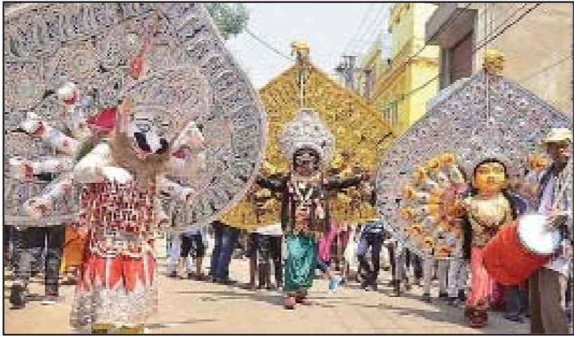
ନାହିଁ । ମହାଦେବଙ୍କ ଅନିଚ୍ଛା ସତ୍ତ୍ୱେ ଦେବୀ ପାର୍ବତୀ ପିତୃଲୋଭ ଯାଆନ୍ତି । ଯଜ୍ଞକୁଣ୍ଡରେ ଦକ୍ଷପ୍ରଜାପତି ଶିବଙ୍କର ଅପମାନ କଲେ ଏହାକୁ ସହି ନପାରି ସତୀ କରିଦେଲେ । ପରବର୍ତ୍ତୀ ସମୟରେ ବ୍ରହ୍ମାଙ୍କ ବରରେ ବଳିୟାନ ହୋଇ ତାରକାସୁର ଅତ୍ୟାଚାର କଲା ।