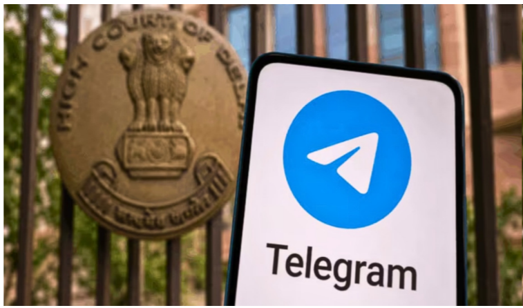
ନ୍ୟୁଆଦିଲ୍ଲୀ, ୧୮:୬: ଲୋକପ୍ରିୟ ସୋସିଆଲ ମିଡ଼ିଆ ନେଟୱାର୍କ ଆପ୍ 'ଟେଲିଗ୍ରାମ୍'ର ଅପରାଧୀଙ୍କୁ ନେଇ ଆଜି କେନ୍ଦ୍ର ସରକାର ଦିଲ୍ଲୀ

ଟେଲିଗ୍ରାମ୍ ପ୍ଲାଟଫର୍ମ ଅପରାଧୀ ଏବଂ ଦେଶବିରୋଧୀ ସଂଗଠନଗୁଡ଼ିକୁ ପାଇଁ ଏକ ପ୍ରମୁଖ ମାଧ୍ୟମ ସାଜିଛି । ଏହି ଆପ୍ ଜରିଆରେ ଆତଙ୍କବାଦୀ କାର୍ଯ୍ୟକଳାପର ସଂଗଠନ, ସାଜସଜ୍ଜା ଅପରାଧ, ଆର୍ଥିକ ଜାଲିଆଡ଼ି ଏବଂ ଦେଶାନ୍ତର ଗୁରୁତର ଚଳାଣି ଭଳି ସଂଗଠିତ ଅପରାଧ ବ୍ୟାପକ ଭାବେ ବୃଦ୍ଧି ପାଇବାରେ ଲାଗିଛି, ଯାହା ଦେଶର ଆଭ୍ୟନ୍ତରୀଣ ସୁରକ୍ଷା ପ୍ରତି ଏକ ବଡ଼ ବିପଦ ସୃଷ୍ଟି କରିଛି । କେନ୍ଦ୍ର ସରକାର ନିଜ ପକ୍ଷ ରଖି କହିଛନ୍ତି ଯେ, ଟେଲିଗ୍ରାମ୍ ଆପରେ ଥିବା କଠୋର 'ଏନକ୍ରିପ୍ଟେଡ୍ ସିକ୍ୟୁରିଟି' ଏବଂ ଦ୍ୟବହାରକାରୀଙ୍କ ପରିଚୟ ଗୋପନ ରଖିବାର ସୁବିଧା ଯୋଗୁଁ ଅପରାଧୀମାନେ ଏହାର ଭରପୂର ପାଇବା ଉଠାଇଛନ୍ତି । ଏହି ଗୋପନୀୟତା ଫିଟରସ୍ ଯୋଗୁଁ ଦେଶର ଆଇନ ଶୁଖିଲା ରକ୍ଷାକାରୀ ସଂସ୍ଥା ଏବଂ