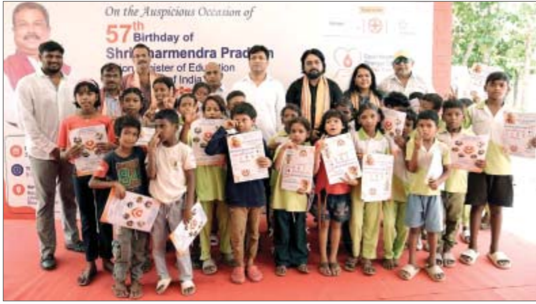
କେନ୍ଦ୍ର ଶିକ୍ଷାମନ୍ତ୍ରୀ ଧର୍ମେନ୍ଦ୍ର ପ୍ରଧାନଙ୍କ ୫୭ତମ ଜନ୍ମଦିନ ପୂର୍ବକ ଦିବ୍ୟ ଅବସରରେ ରେଡକ୍ରସ୍ ଭବନରେ ସ୍ୱାସ୍ଥ୍ୟ ପରୀକ୍ଷା ଉତ୍ସାହୀନ ଶିବିର (ଫଟୋ ଦିନଲିପି)