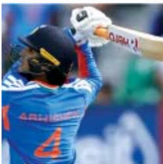
ମ୍ୟାଚରେ ଭାରତୀୟ କ୍ରିକେଟ୍ ଟିମ୍ ଦ୍ୱାରା ଶିବିରରେ ଆର୍ଯ୍ୟଲକ୍ଷ୍ମ ନିଷ୍ପତ୍ତି ନେଇଥିବା ଘରୋଇ ଦଳ ପ୍ରଥମେ ବ୍ୟାଟିଂ କରିଥିବା ଆର୍ଯ୍ୟଲକ୍ଷ୍ମ ପାଇଁ ଅଧିନାୟକ ଭାବେ ଚଳିଥିବା ଫଟୋ

ବେଙ୍ଗାଳୁରୁ, ୨୭/୧୦: ଆର୍ଯ୍ୟଲକ୍ଷ୍ମ ଘରୋଇ ମାଟିରେ ଦମଦମ ପ୍ରଦର୍ଶନ କରିଛନ୍ତି। ଦଳ ପ୍ରଥମେ ନିର୍ଦ୍ଧାରିତ ୨୦ ଓଭରରେ ୧୧୫ରୁ କମ୍ ହରାଇ ୧୮୨ ରନ୍ କରିଛି। ଘରୋଇ ବୋଲିଂ କ୍ଷେତ୍ରରେ ଦମଦମ ପ୍ରଦର୍ଶନ କରି ଭାରତକୁ ୧୪୮ ରନ୍ରେ ଅଟକାଇଛି। ୧୮୩ ରନ୍ରେ ବିଜୟ ଲକ୍ଷ୍ୟ ନେଇ ବ୍ୟାଟିଂ କରିଥିବା ଭାରତ ୧୮.୫ ଓଭରରେ ସମସ୍ତ ଟ୍ରେକେଟ୍ ହରାଇଛି। ଫଳରେ ଘରୋଇ ଦଳ ଏହି ମ୍ୟାଚକୁ ୩୪ ରନ୍ରେ ବିଜୟ ହାସଲ କରିଛି। ଏଥି ସହିତ ଭାରତ ବିପକ୍ଷରେ ଆର୍ଯ୍ୟଲକ୍ଷ୍ମର ଐତିହାସିକ ବିଜୟ ହାସଲ କରିଛି। ଦୁଇ ମ୍ୟାଚ୍ ବିଶିଷ୍ଟ ୧୨୦ ଖଞ୍ଜକାର ପ୍ରଥମ ପ୍ରକାଶିତ ସ୍ତରୀୟ ବିଭିନ୍ନ ସର୍ବିସ କ୍ରିକେଟ୍ କ୍ଲବ୍ରେ ଖେଳାଯାଇଛି। ଏହି