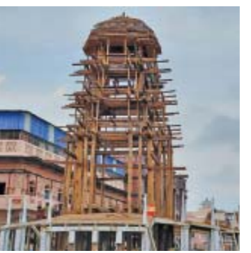
ଗୋଟି ଲେଖାଏଁ ୨୦ ପୁଟିଆ ଜଗତ ପୁଷ୍ପ ସେଣ୍ଡି ପଢ଼ି କଣ୍ଠା ବାଡ଼ିଆ ଶେଷ ହୋଇଛି। ଦେବୀ ଚାରି ପାର୍ଶ୍ୱରେ ପଟା କାଟିଆ ଶେଷ ହୋଇଥିବାରୁ, ଦେବୀ ପରିସରକୁ ବହାଳବା ପାଇଁ ସେଣ୍ଡି ପଟନ ରେ ଦେବୀ ଭଲ ପାରୁଥିବା ତିନୋଟି ଲେଖାଏଁ ୨ ଟି ରୂପ ଖୋଦେଇ କାର୍ଯ୍ୟ କରାଯାଇଛି। ତିନିରଥ ମହାରଣା ବାହୁଡ଼ ପାଟିଆ ପଢ଼ି ପଟା ପକାଯାଇ ଦେବୀ ପ୍ରସ୍ତୁତ କରାଯିବ।