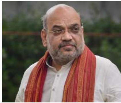
ଗୃହମନ୍ତ୍ରୀ ଅମିତ୍ ଶାହଙ୍କ ଗୋଷ୍ଠୀର ଅଧିକ ନେତାଙ୍କୁ ସ୍ଥାନ ମିଳିବାର ସମ୍ଭାବନା ରହିଛି। ଅନ୍ୟପକ୍ଷରେ

ପ୍ରତିରକ୍ଷା ମନ୍ତ୍ରୀ ରାଜନାଥ ସିଂହ କ୍ୟାବିନେଟ୍‌ରୁ ଉସ୍ତଫା ଦେଇପାରନ୍ତି। ଆହୁରି କାଣ୍ଡିବାକୁ ମିଳିଛି ଯେ, ଆସପାସନ୍ତ ରାଷ୍ଟ୍ରପତି ଦ୍ରୌପଦୀ ମୁର୍ମୁଙ୍କ କାର୍ଯ୍ୟକାଳ ଶେଷ ହେଉଥିବାରୁ ରାଜନାଥ ସିଂହଙ୍କୁ ବିକେପି ରାଷ୍ଟ୍ରପତି ପଦ ପାଇଁ ପ୍ରାର୍ଥନା କରିପାରେ। ଅନ୍ୟପକ୍ଷରେ ଅମିତ୍ ଶାହଙ୍କୁ ପଦୋନ୍ନତି ଭାବେ ଉପପ୍ରଧାନମନ୍ତ୍ରୀ ପଦ ଦାବି କରିବାକୁ କୁହାଯାଇଛି। ବିକେପି ନିଜର ପୁରାପୁର ପ୍ରସ୍ତୁତ କରିସାରିଛନ୍ତି। ଏବେ ସମସ୍ତଙ୍କ ନଜର ସମାବଦ୍ୟ କ୍ୟାବିନେଟ୍ ସମ୍ପର୍କରେ ଓ ବିଭାଗ ବନ୍ଧନ ଉପରେ ରହିଛି। କେନ୍ଦ୍ର ଶିକ୍ଷାମନ୍ତ୍ରୀ ଧର୍ମେନ୍ଦ୍ର ପ୍ରଧାନ, ପେଟ୍ରୋଲିୟମ ମନ୍ତ୍ରୀ ହରଦୀପ ସିଂହ ପୁରାଙ୍କୁ ସମେତ କେତେକ କେନ୍ଦ୍ରମନ୍ତ୍ରୀଙ୍କ ବିଭାଗ ଅଦଳବଦଳ