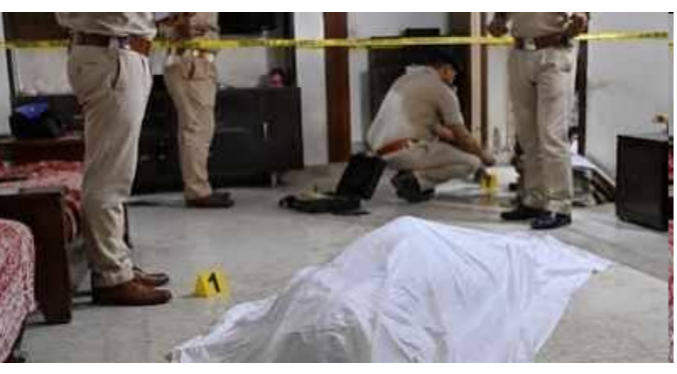
କଟକ, ୫.୧୭ : ଚାନ୍ଦିଆଖି ଘଟଣାରେ ପୋଲିସ୍ ୨ଟି ମୋବାଇଲ ଜବତ ଆନାଧିକାରୀଙ୍କୁ ବିସ୍ତୃତି ମହାନ୍ତି ମୃତ୍ୟୁ

ପାଇଁ ପଠାଇଛି । ମୋବାଇଲକୁ ଆମ୍ବୁହତ୍ୟା ପଛର କିଛି ତଥ୍ୟ ମିଳିପାରେ ବୋଲି ପୋଲିସ୍ ଆଶା କରୁଛି । ଏପରିକି ଚାକର ସୋସିଆଲ ମିଡ଼ିଆ ଏବଂ ହାତୁଆପ ଚାଟରୁ କିଛି ତଥ୍ୟ କାଟ୍‌ବାକୁ ପୁଲିସ୍ ଉଦ୍ୟମ କରୁଛି । ଆଇଆଇସି ବିସ୍ତୃତି ମହାନ୍ତି ଆମ୍ବୁହତ୍ୟା ଘଟଣାରେ କମିଶନରେଟ୍ ପୋଲିସ୍ ଜଣେ ପୋଲିସ୍ କର୍ମଚାରୀଙ୍କୁ ଅଟକ ରଖି ଜେରା କରୁଛି । ଅଧିକ ସ୍ଥାନରେ ଅଟକ ରଖି ଜେରା କରୁଛି ପୋଲିସ୍ । ରବିବାର ଅପରାହ୍ଣ ସମୟରେ ଓଡ଼ିଶା ପୋଲିସ୍ ଅର୍ଡ଼ର ମହାସଂଘ ପକ୍ଷରୁ ଏକ ସାମ୍ବାଦିକ ସମ୍ମିଳନୀରେ ଏହି ଘଟଣାର ସ୍ୱଚ୍ଛ, ନିରପେକ୍ଷ ଓ ଉଚ୍ଚସ୍ତରୀୟ ତଦନ୍ତ କରି ୩୦ ଦିନ ମଧ୍ୟରେ ରିପୋର୍ଟକୁ ଆସର୍ଭକନାନ କରିବାକୁ ରାଜ୍ୟ ସରକାର ଓ ପୋଲିସ୍ ମହାନିର୍ଦ୍ଦେଶକଙ୍କ ନିକଟରେ ଦାବି କରାଯାଇଛି । ଉଲ୍ଲେଖ ଯୋଗ୍ୟ ଯେ, ଶନିବାର ଦିନ ସକାଳୁ କଟକ ଚାନ୍ଦିଆଖି ଆନା ଆଇଆଇସି ବିସ୍ତୃତି ମହାନ୍ତିଙ୍କ ଝୁଲିତା ମୃତ ଦେହ ଆନା ଉପରେ ଥିବା ଚାକ ବିଶ୍ଳେଷଣ କରାଯାଇଛି । ମାନସିକ ଉତ୍ତରା ଭୃତ ହେବା ନେଇ ସେ ଆମ୍ବୁହତ୍ୟା କରିଛନ୍ତି ତାହାର ଉତ୍ତର କୌଣସି ସ୍ୱପ୍ନ ମିଳିନଥିଲା । ତେବେ ପରିବାର ଓ ସଂପର୍କୀୟଙ୍କ ପକ୍ଷରୁ କାମ ଚାପରୁ ସେ ଆମ୍ବୁହତ୍ୟା କରିଥିବା ସନ୍ଦେହ କରାଯାଇଥିବା ବେଳେ ଚାକ ଭଳି ଦକ୍ଷ ଓ ଦୃଢ଼ମନା କେବେ ଆମ୍ବୁହତ୍ୟା କରିପାରିବେ ନାହିଁ ବୋଲି ମଧ୍ୟ କହୁଛନ୍ତି । କେହି ହତ୍ୟା କରି ଆମ୍ବୁହତ୍ୟାର ରୂପ ଦିଆଯାଉଥିବା ଚାକ ଭାବ ଅଭିଯୋଗ କରିଥିଲେ । ମୃତ ଆଇଆଇସିଙ୍କ ସ୍ୱାମୀ, ଉତ୍ତରା, ଦେବସ୍ୱର ପରିବାର ପରିଜନଙ୍କୁ ପଚରା ଭୃତ ଭାବ କରାଯାଇଛି । ମାନସିକ ଉତ୍ତରା ଭୃତ ହେବା ନେଇ ସେ ଆମ୍ବୁହତ୍ୟା କରିଛନ୍ତି ତାହାର ଉତ୍ତର କୌଣସି ସ୍ୱପ୍ନ ମିଳିନଥିଲା । ତେବେ