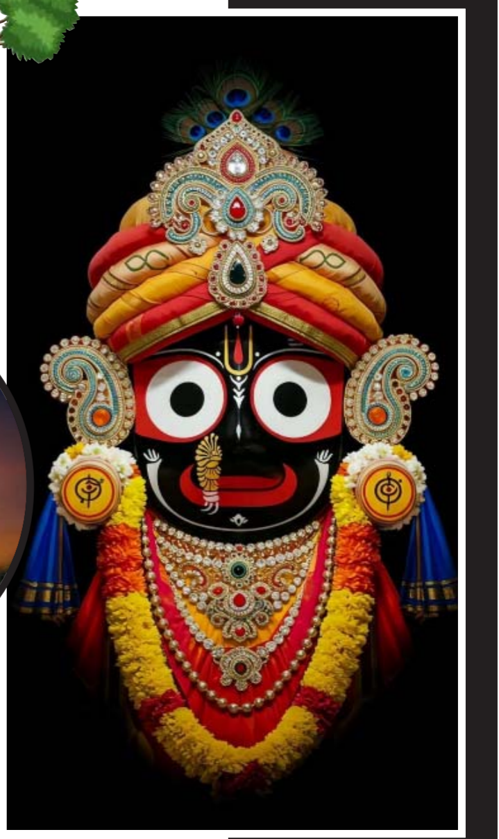
କରିବାର ମହାରିପ୍ରାୟରେ ଶ୍ରୀଜଗନ୍ନାଥ ବାହୁସାରି ସମସ୍ତଙ୍କୁ ଆପଣା କରିନେଇଛନ୍ତି । ସମସ୍ତଙ୍କୁ ସେବାଧିକାର ଦେବ ନିମିତ୍ତ ସେ ଛତିଶା ନିଯୋଗ ରିଆଇଛନ୍ତି ।

ସଂସ୍କାର ଓ ଉତ୍ତରଶାଳତାଦ୍ୱାରା ଉର୍ଦ୍ଧ୍ୱଗୁଣା ହୋଇ ଏହା ମାନବିକତାର ପକସ୍ତର ଶକ୍ତିରେ ସମୃଦ୍ଧ । ପୁରନାଯୋଗ୍ୟ ଯେ, ସୁଦୀର୍ଘ ପରମ୍ପରା ଏହାକୁ ଉଜ୍ଜୀବିତ ରଖିବା ସହିତ ଆତ୍ମିକ ସମନ୍ତ ଭାବରେ ପ୍ରତିଭାତ ହୋଇ ନୈତିକତା, ମର୍ଯ୍ୟାଦାବୋଧ ଓ ସୁଜନଶାଳତାକୁ ଭବ୍ୟରୂପେ ପ୍ରଦାନ କରିପାରିଛି । ଅଧିକତ୍ୱ, ପରମ୍ପରା । କୁମାରତ ଧାରା ଜଗନ୍ନାଥ ସଂସ୍କୃତି ସହିତ ଜୀବନର ସମ୍ପର୍କକୁ ପ୍ରତିଷ୍ଠିତ କରି ପାରିଛି । ପରିଶ୍ରମ ସ୍ୱରୂପ, ଏହାର ସ୍ତ୍ରୋତରେ ଅବଗାହନ କରୁଥିବା ପ୍ରତ୍ୟେକଟି ବ୍ୟକ୍ତି, ଜାତି, ଗୋଷ୍ଠୀ ଓ ସମାଜର ଜନଜୀବନ ସୁଖାନ୍ୱିତ, ସୁସଂହତ, ସମୃଦ୍ଧ ଓ ସମାନ୍ୟ । ଏହି ପ୍ରବାହମାନ ଧାରାରେ ଆଧ୍ୟାତ୍ମିକ ଶିକ୍ଷାବୋଧର ଉନ୍ନତ ରୁଚି, ବୌଦ୍ଧିକ ସୁଜନଶାଳତା ଓ ସଂସ୍କାରବୋଧ ତିର ଜାଣିଲ୍ୟମାନ । ଶ୍ରୀଜଗନ୍ନାଥଙ୍କ ନିତ୍ୟ ସମାହିତ ତିନିଧି ପାଞ୍ଚ ଅବକାଶ ରାତିରେ ପୂଜା, ନୈମିତ୍ତିକ ପର୍ବପର୍ବାଣୀ ଓ ବାରମାସରେ ସଂଘଟିତ ତେର ଯାତ୍ରା ଜଗନ୍ନାଥ ସଂସ୍କୃତିକୁ ସୁସଙ୍ଗଠିତ କରିପାରିଛି । ଏଥିରେ ସମାଜର ସକଳଶ୍ରେଣୀ ସକ୍ରିୟ ଅଂଶଗ୍ରହଣ କରି ମହାନୀୟତା ହେଉଛି, କୁମାରତ,