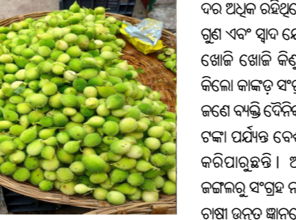
କରି ସ୍ଥାନୀୟ ଯାତ ଓ ବଜାରରେ ବିକ୍ରି କରୁଛନ୍ତି । ବର୍ତ୍ତମାନ ବଜାରରେ କାକଡ଼ କଷିର ଦର କିଲୋ ପ୍ରତି ୩୫୦ ରୁ ୪୦୦ ଟଙ୍କା ପର୍ଯ୍ୟନ୍ତ ରହିଛି ।

ସୋନପୁର, (ନିପ୍ର): ବର୍ଷା ଦିନ ଆସିଲେ ବଜାରରେ ସ୍ଥାନୀୟ ପରିବାର ଏକ ସୁଖ ଚାହିଦା ଦେଖିବାକୁ ମିଳେ । ବିଶେଷ କରି ସୁଆଦିଆ ତଥା ଔଷଧୀୟ ରୁଗରେ ଭରପୁର ‘କାକଡ଼’ ବା କାକଡ଼ କଷି ପାଇଁ ଗ୍ରାହକଙ୍କ ମଧ୍ୟରେ ପ୍ରଚଳ ଆଗ୍ରହ ରହିଥାଏ । ଏବେ ଏହି ଋତୁକାଳୀନ ପରିବା ଅନେକ ଗରିବ ଚାଷୀ ଏବଂ ଜଙ୍ଗଲ ଉପରେ ନିର୍ଭର କରୁଥିବା ଲୋକଙ୍କ ପାଇଁ ଏକ ପ୍ରମୁଖ ରୋଜଗାରର ମାଧ୍ୟମ ପାଇବିଛି । ସୁବର୍ଣ୍ଣପୁର ଏବଂ ଏହାର ଆଖପାଖ ଅଞ୍ଚଳର ଜଙ୍ଗଲରୁ ସ୍ଥାନୀୟ ଲୋକେ ପ୍ରାକୃତିକ ଭାବରେ ଫଳୁଥିବା କାକଡ଼ ସଂଗ୍ରହ