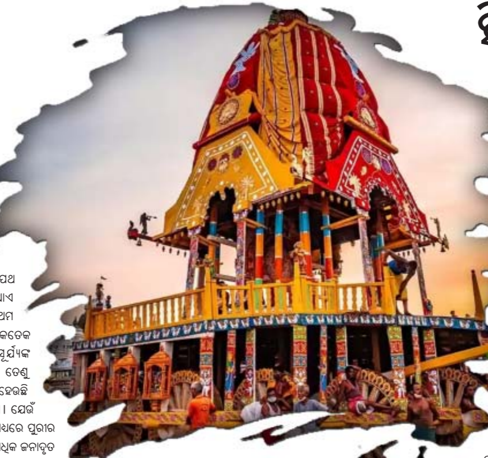
୧୦୮ କ ଦିନ ଶନିକ ସ୍ୱରୂପ ଓ ରବିବାର ଦିନ ରବିକ ସ୍ୱରୂପ ଭାବରେ ପୂଜା ପାଆନ୍ତି । କିନ୍ତୁ ରାହୁ ଓ କେତୁ ଏ ଦୁଇ ଗ୍ରହଙ୍କ ସ୍ୱତନ୍ତ୍ର ବାର ନଥିବା ହେତୁ ପ୍ରଥମ ଗୁଣ୍ଡିଚା ଯୋଗ୍ୟଯାତ୍ରା ଓ ଶେଷ ବାହୁଡ଼ା ଏ ଦୁଇ ଦିବସକୁ ରାହୁ ଓ କେତୁଙ୍କ ପାଇଁ ନିର୍ଦ୍ଦିଷ୍ଟ ବୋଲି ନିର୍ଦ୍ଦିଷ୍ଟ କରାଯାଏ ।

୩. ଆତ୍ମପ ଉତ୍ସବ, ୪. ଦକ୍ଷିଣାମୁଖା ଉତ୍ସବ ଓ ୫. ନାଳାତ୍ରି ବିଜେ । ଏହାକୁ ଗୁଣ୍ଡିଚା ପଞ୍ଚକ କୁହାଯାଏ । ରଥଯାତ୍ରା ବହୁ ପ୍ରାଚୀନ ବୋଲି ଗବେଷକମାନେ ମତ ପ୍ରଦାନ କରିଛନ୍ତି । ରଗବେଦ ଓ ଅଥର୍ବ ବେଦ ଜତ୍ୟାଦିରେ ରଥ ଶବ୍ଦର ପ୍ରୟୋଗ ଦେଖାଯାଏ । ପରବର୍ତ୍ତୀ କାଳରେ ଶତପଥ ବ୍ରାହ୍ମଣ ଗ୍ରନ୍ଥରେ ମଧ୍ୟ ଏହାର ଆଲୋଚନା ମିଳିଥାଏ । ଖ୍ରୀଷ୍ଟପୂର୍ବ ଦ୍ୱିତୀୟ ଶତାବ୍ଦୀରୁ ଖ୍ରୀଷ୍ଟପୂର୍ବ ପ୍ରଥମ ଶତାବ୍ଦୀ ମଧ୍ୟରେ ଖୋଦିତ ହୋଇଥିବା କେତେକ ପ୍ରାଚୀନ ରାଷ୍ଟ୍ରୀୟକୁ ଅନୁଧ୍ୟାନ କଲେ ସୂର୍ଯ୍ୟଙ୍କ ରଥଯାତ୍ରାର ସମ୍ୟକ୍ ନିବର୍ତ୍ତନ ମିଳିଥାଏ । ତେଣୁ ସୂର୍ଯ୍ୟଙ୍କ ରଥଯାତ୍ରାର ପରବର୍ତ୍ତୀ ପରିକଳ୍ପନା ହେଉଛି ପୁରୁଷୋତ୍ତମ କ୍ଷେତ୍ରସ୍ଥ ମହାପ୍ରଭୁଙ୍କ ରଥଯାତ୍ରା । ଯେଉଁ ସବୁ ରଥଯାତ୍ରାର ଉଲ୍ଲେଖ ହୋଇଛି ସେଥି ମଧ୍ୟରେ ପୁରୀର ଶ୍ରୀଜଗନ୍ନାଥଙ୍କ ରଥଯାତ୍ରା ହେଉଛି ସବୁଠାରୁ ଅଧିକ ଜନାଦୃତ ଓ ପ୍ରସାରିତ । କେତେକ ଗବେଷକ ଶ୍ରୀଜଗନ୍ନାଥଙ୍କ ରଥଯାତ୍ରା ପରମ୍ପରାରୁ ସୃଷ୍ଟି ହୋଇଛି ବୋଲି ଅନୁମାନ କରନ୍ତି । କାରଣ ଖ୍ରୀଷ୍ଟୀୟ ପଞ୍ଚମ ଶତାବ୍ଦୀର ପ୍ରାରମ୍ଭରେ ଚୀନ ପରିବ୍ରାଜକ ଫାହିୟାନ ଖୋଦିତ ହୋଇଥିବା ଅନୁସୂଚିତ ରଥଯାତ୍ରାର ଯେଉଁ ବିବରଣୀ ଲିପିବଦ୍ଧ କରିଛନ୍ତି, ତାହା ଆଜିପୁଣ୍ୟ ପ୍ରଚଳିତ ଜଗନ୍ନାଥଙ୍କ ସ୍ନାନଯାତ୍ରା ଓ ରଥଯାତ୍ରା ସହ ମେଳ ଖାଉଛି ।