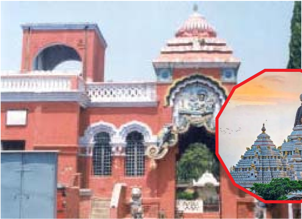
ସାତ ପାହାଚଠାରେ ଶ୍ରୀବିଗ୍ରହମାନେ ବାଉଁଶ ପାଟିଆ, ସୋଳ, ବିଭିନ୍ନ ପୁଷ୍ପ, ତୁଳସୀ, ବୁଦ୍ଧ ଇତ୍ୟାଦି ସାମଗ୍ରୀରେ ଏକ ସ୍ୱତନ୍ତ୍ର ଶୈଳୀରେ ନିର୍ମିତ ୪ ଗୋଟି ବଡ଼ ହାରିୟା ମଠ ଯୋଗାଇଥାନ୍ତି । ଶ୍ରୀଗୁଣ୍ଡିଚା ଦିନ ସକାଳ ଧୂପରେ ମଠର ଖେଚୁଡ଼ି ଭୋଗ ହୋଇଥାଏ । ରଥ ଉପର ଠାକୁରମାନେ